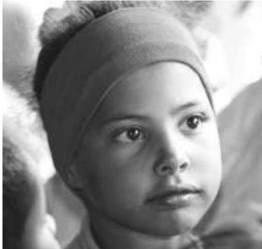
Errefuxiatuen kanpamentuetako saharar neskatila bat. I.T.

Proiektu honetan parte hartzen duten udalek bidai gastuak ordaindu eta pertsona bat kontratatzen dute koordinazio lanak egiteko, azterketa medikoetan eta gaztetxoak hartzen dituzten familiakoekin harremanetan egoteko, sor daitezkeen gaiei erantzuteko. Bestalde, Saharako begirale bat ere izango da. Baina, Tolosaldea Sahararekin elkarteko kideek azaldu bezala, «ezinbestekoa, 7-12 urteko haur hauek hartzeko prest dauden familiak dira». Udalei dagokionez, Alegia (1), Anoeta (1), Ibarra (1-2), Leaburu-Txarama (2), Tolosa (10) eta Villabonakoa (2) dira haurrak hartzeko laguntza ematen dutenak.