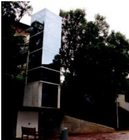
Igogailua mugikortasuna hobetze aldera eraiki dute.

Besteak beste, igogailu bat instalatu dute «mugikortasuna hobetze aldera, auzoaren goiko aldeko eta beheko aldeko irisgarritasun ara-