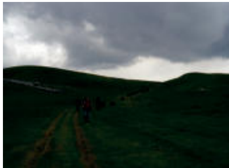
Igaratza igaro eta Minetarako bidean, argazki ederra. AITZIBER LOPEZ