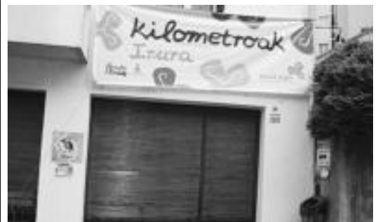
Irurako Kilometroak laguntzeko taberna jarri dute jaietan.