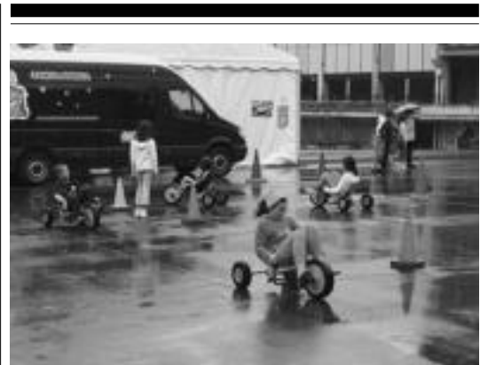
Haurrentzat aukera ugari egon zen atzokoan Anoetako Jaietan. A. IMAZ