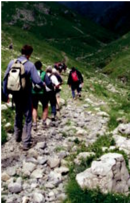
Minak jaisten ari ziren mendizaleak. XABIER JAUREGI