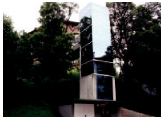
Zizurkilgo auzoko lanetan 658.307 euro inbertitu ditu Udalak. N. URBIZU