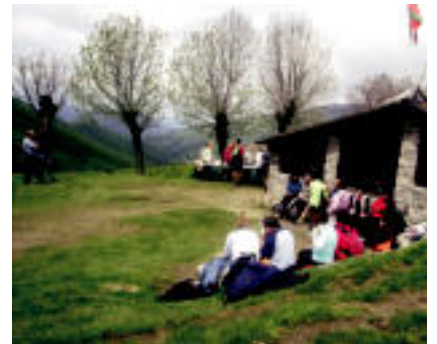
Igarantzara jende ugari hurbildu zen ikusle bazala. NAIARA ORTIZ