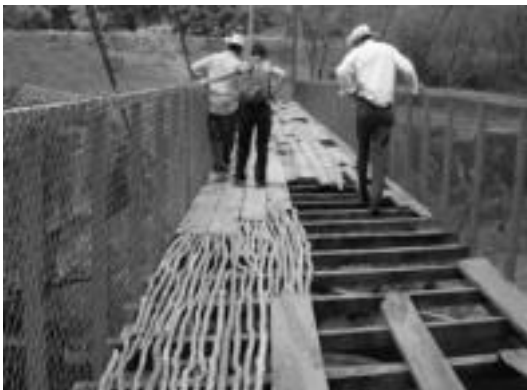
Hainbat proiekturen berri jaso daiteke erakusketan. HITZA

Erakusketara joaten denak komunitateari buruzko hainbat argazki ikus ditzake eta baita bere historia eta egungo egoeraren berri jakin ere.