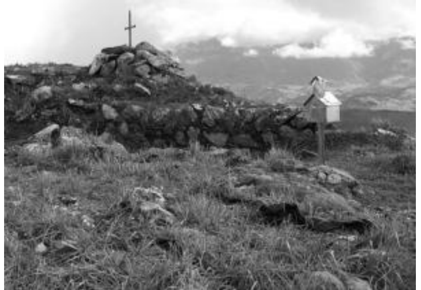
Mendikuteko gainan zegoen gazteluaren aztarnak ikusiko dituzte igandeko txangoan. ESTI EZEIZA

Erromatarren garaitik gaur arteko aztarnak ikus daitezke Mendikutera bidean. Horien artean, Erdi