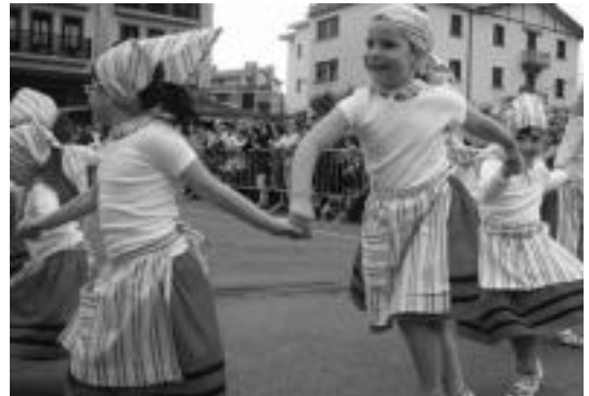
200 dantzarik gora izan ziren igandean Anoetako kaleetan. HITZA

Bihar izango da Korpus Eguna eta horrekin batera ere haurren eguna izango da. Horrela, egun horretan barrakak merkeago izango dira. Bestalde, Udalak dei egin du arratsaldeko buruhandi eta erraldioen