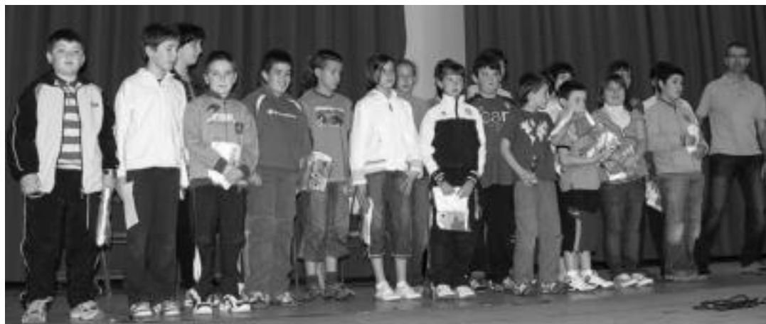
Argazkian, saria eta aipamena jaso zutenak, pasa den ostiralean, Leitzako zineman. MIKEL ILLARREGI

Leitza » Ostiralean sari banaketa egin zuten eta Nafarroa mailako irabazleak aipatu zituzten.