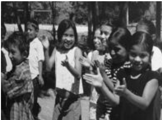
Segundo Montes komunitateko haur batzuk. HITZA