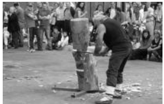
Herri kirolen erakustaldia ikusteko aukera izan zuten igandean. HITZA

kalejiran haurrak mozorrotuta ateratzeko. Aurreko egunei dagozkionez, aipatzekoa da Irura, Iba-