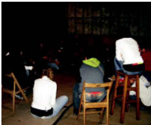
Duhalderen kontzertua eta gero kantarien topaketa egin zuten. N. GARZIA

35 lagun besterik ez ziren bildu Anje Duhalderen emanaldia ikusteko, baina bertaratu zirenak adi egon ziren abeslariaren hitzaldia jarraitzen. Duhalde euskal kantagintzaren historiaren laburpen bat egin zuen, 90. hamarkadara