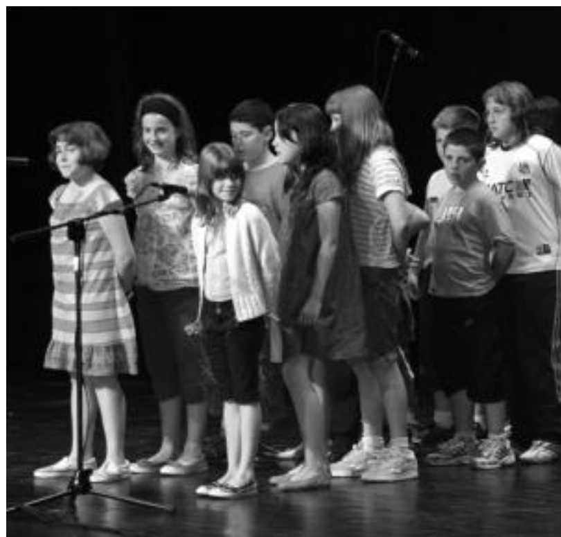
Laskorain, Samaniego eta Hirukide ikastetxeetako laugarren mailako ikasleak aritu ziren hilaren 13an, Leidorren. E.E