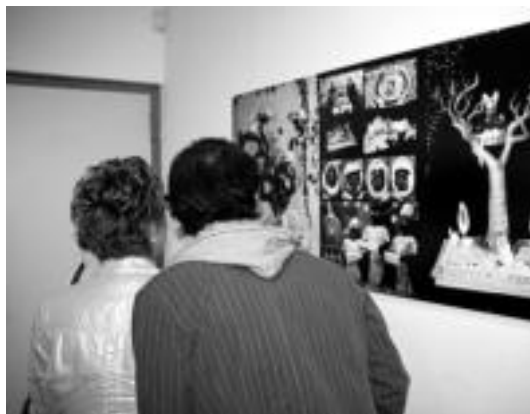
Aranburu jauregian Gorrotxategi egindako argazkien erakusketa dago. N. U.

Kanpoan, udaletxeko arkupean teletibista handi bat jarri zuten ber-