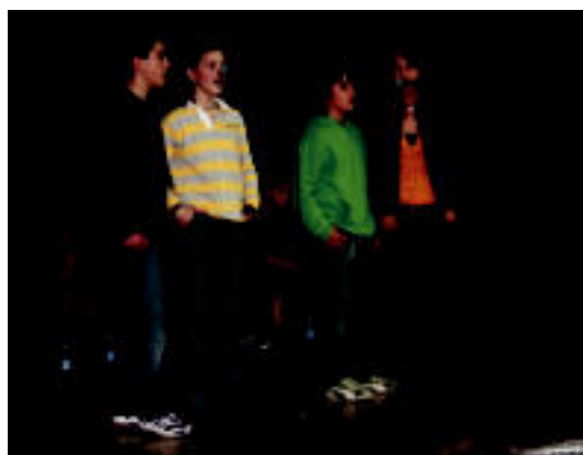
Atzoko Bertso Txapelketako une bat. N. URBIZU

TOLOSA Gehitu elkarteak ikusgai jarri du Tolosako Kultur Etxean historian zehar ospetsu egin diren homosexualen erakusketa 2