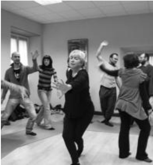
Pasa den urteko Atauneko edizioko une bat.