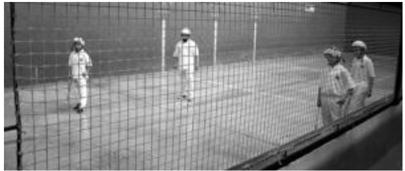
Irurako Trinketeen Pilota Eskolako haurren partidak izan ziren atzo, Kultur Astearen baitan.

Hasteko, dirua jarri heziketa funtzio hori bultzatzeko eta gero hezitzeko. Orain entzuten diren kantu asko kulturalki oso balore gutxiokoa dira. Jendeak, horrela uste du kantu tontakeria bat dela, ongi pasatzeko produktu bat. Ez badugu baloratzen musika arte bezala, zertarako ordaindu disko bat? Non entzun daiteke, adibidez, Bob Marleyri buruzko historia? Edo Ez dok 13ren historia? Irrati saio batzuk kenduta, ez dago eskaintza hori. Musika kultura da eta hori baloratzeke lana egin behar da, jendeak balora dezan. Jendeak gero aukeratu du zer den ona eta zer ez. Baina irratia bezala, telebista ere. Kultura saiorik onenak ordu txikitatzen eta asteazken zehar daude... Norik ikusiko ditu?