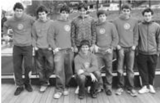
Tolosaldea Igeriketa Taldeko kideetako batzuk.

Igeriketa » 10 igerilarik hartu zuten parte; hegats bakarreo igeriketan ere maila handia dutela ari dira erakusketa eskualdekoak.