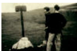
Baterako eta besterako bideak elkartzen diren parajearen irudia. 1972

Igaratza Bere garaiari, Aralar adiskideek bideguru utziaren jarraituko harritzko seinaleak bidea ageritzen dio mendizaleari.