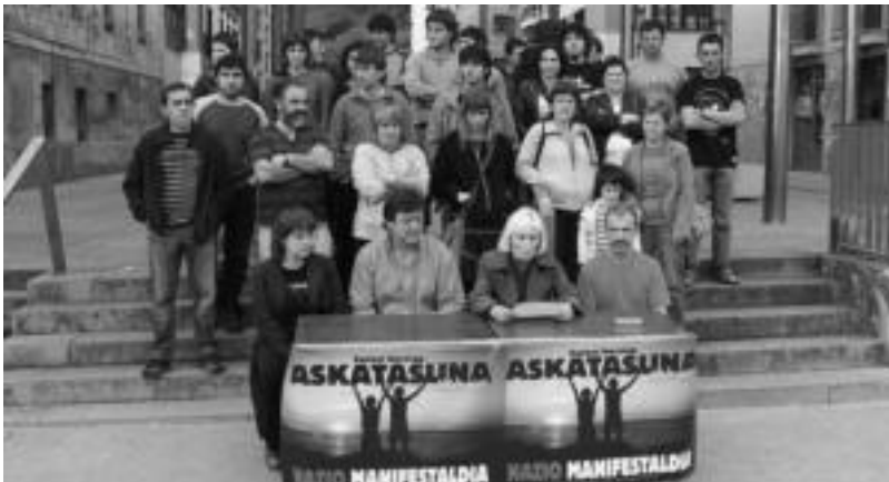
Politika, kultur eta kirol munduko jendeak bat egin dute AAMren aurkako auziaren inputatuekin. I. GARCIA