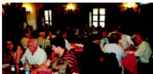
Bazkariak izan ziren, Zizurkilgo Plaza etxeberrri jatetxeko kasu. I. GARCIA