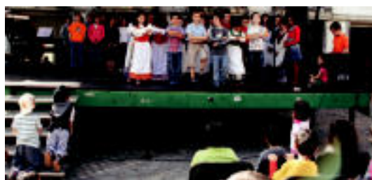
Loatzo musika eskolako ikasleen emanaldia Iruran. A. IMAZ