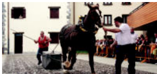
Asteasuko Olarreaga-Goikoa baserriko behorra ahaleginetan. I. GARCIA