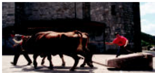
Amasako idi-demaren une bat. I. GARCIA

diak ere izan ziren eta Anoetan hitzaldia izan zuten karobiei buruz. Aipatutako herri guztietan (Anoetan izan ezik, larunbatean egin baitzuten afora) eta Alkizan ere mahai inguruan elkartu ziren baserri-tarren eguna ospatu asmoz.