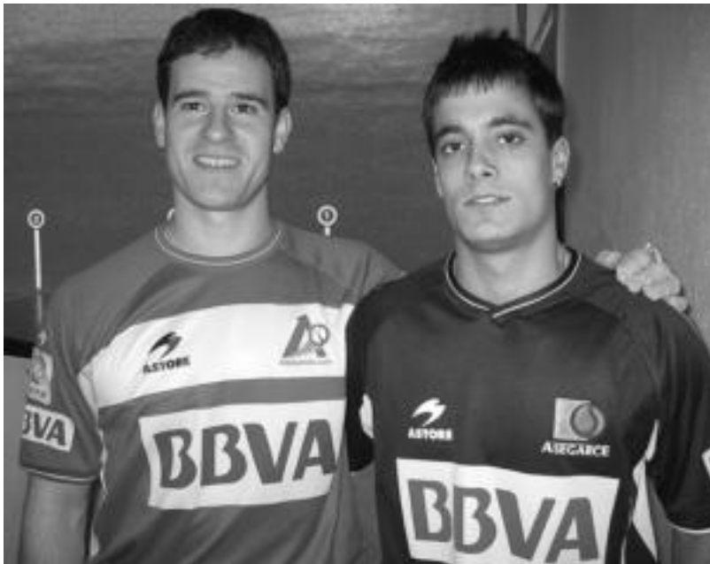
Lizartzako Kultur Astearen Barriola eta Bengoetxea egongo dira beste pilotariekin batera, baina frontoitik kanpo. I.S.