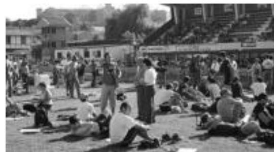
Parte-hartzaileak Berazubin ibilaldia bukatu ostean, 2004ean. i.e.

KIROLA ● Igandean abiatuko dira mendizaleak XIV Orduko Ibilaldia egiteko helburuz; Berazubi izango da irteera eta helmuga.