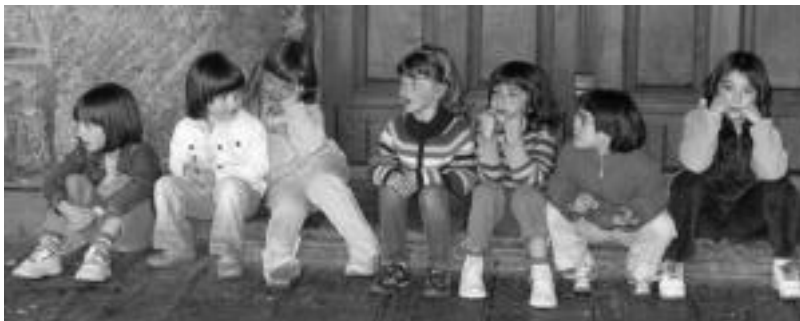
Musika ere jarri zuten eta umeak gustura aritu ziren kantari. N. GARZIA