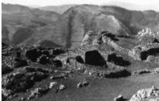
Ausa Gazteluko gainan dauden aztarnak argiak dira. G. E.

Zaldibia eta Abaltzisketa artean, Aralarreko mendilerroan, ia 1.000 metrora dagoen Ausa Gaztelua, antzinako kostako bidea zaintzen