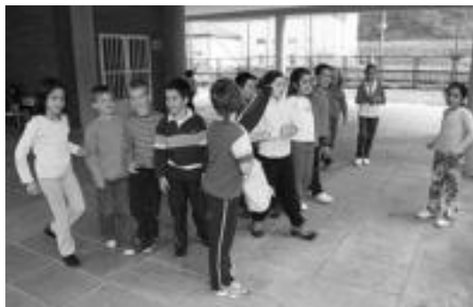
Hirugarren mailako ikasleak, Txinako joku batean gozatzen. N. URBIZU

Nafarroako erresumak 280 gaztelu inguru zituen, eta hiru, Tolosaldean eta Leitzaldean: «Tolosaldean Ausa Gaztelu eta Mendikute ditugu Urkizutik gora abiatuta. Beste bat Leitza dago. Areson ere badela esaten da baina izan daiteke Leitzakoa eta Aresokoa gaztelu bera izatea». Dirudienez, Nafarroa Garaian daude gaztelu gehienak.