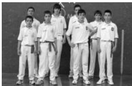
Herriarteko Txapelketan, alebinak eta haur-kategoriakoak. HITZA

Amazabal pilotalekuan jokatu zituzten norgehiagokak. Sagastibeltza Lasartek eta Gartziazenak Zudaiereri eta Uztarrozi aise irabazi zieten, 18-0eko emaitzarekin. Haur-kategorian, berriz, gauzak alderantziz joan ziren, Igartua eta Hernandezenak 3-18 galdu baitzuten Idoate eta Berezaren aurka. Gazteen mailan Jaunarenak eta Sagastibeltzak Zabaleta eta Galar-