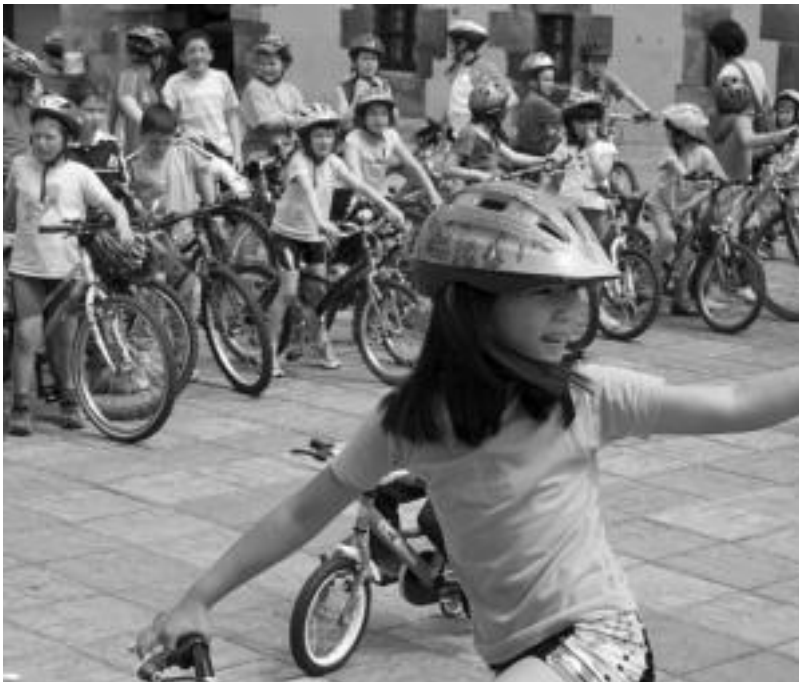
Haur eta guraso ugari bildu ziren bizikleta gainean etzi, herrian barrena itzulida egiteko asmoz. ASIER IMAZ