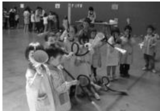
Astelehenean eskulanak egin zituzten frontoian. HITZA

Asteartean bizikleta martxa egin zuten herrian barrena, atzo berriz jaialdia eskaini zien herritarrei.