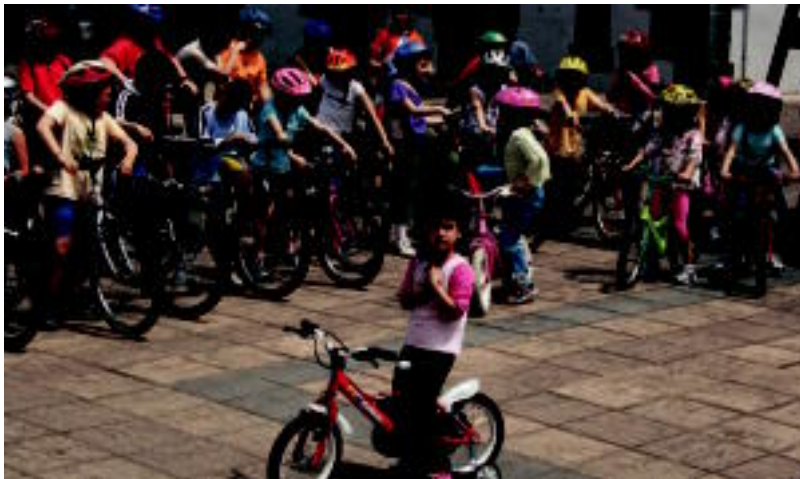
Txirriinduen gainean ibili ziren atzo haurrak zein gurasoak.

ELKARTEA Cederna-Garalur eta Udalak deituta, bilerak ari dira egiten dendariekin, elkarteak sortu ala ez aztertzeko 7