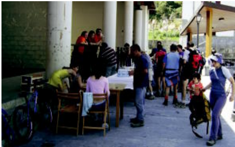
Erniopeko V. ibilaldian, Albizturko plazako homidura gunean jendea indarrak hartzen.

Aurten VI. Mendi Ibilaldia antolatu du Erniozaleak Kultur Elkarteak. Ernio mendia zortzi herri inguratzen dute, eta helburua hori da: «Inguru hori ezagutzera ematea». Ibilbide luzeaginez gero-ig-