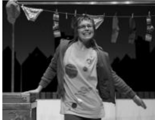
Magia teilatuetan antzezlanaz izango da haurrentzat, etzi. HITZA

Anade fundazioak ezintasun edo gaixotasun mentalak dituztenekin egiten du lan. Hauek gizarteratze eta lan munduan sartzeko helburuarekin. Xede hau lortzeko bi-