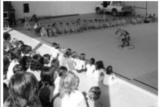
Belabieta gimnastika erritmikokoek emanaldia eskaini zuten Berrobin. A. IMAZ