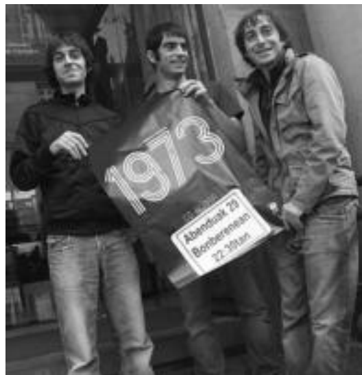
Deabruak Teilatuetan taldekoek 1973, bere azken lana aurkeztuko dute. E. E.

Ostrukaren zuloa lanean honako gogoeta hau egiten da: «beldurragatik benetan egitea nahi duguna alde batera uzten dugu, eta horren ordez nahi dugunetik gertu dagoen kontsolazio sari batekin konformatzen gara; eta batzuetan ezta hori ere. Hori dio behintzat autoreak».