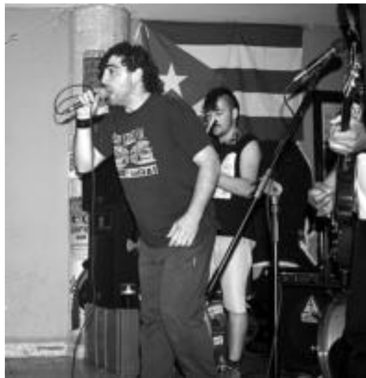
Apirila Gorriari amaiera emateko kontzertuak izan ziren Otsabin. N. URBIZU

ari aurre egiten duten prozesu eraldatzaileak suposatzen baitutela. Eta bestetik, Palestina erabaki genuen, palestinar herriak pairatzen duen zapalketa sionista munduko toki guztietan ezagutua izan behar delako. Era berean, Palestinaren aurkako sa-