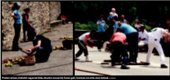
Proben artean, ikiskidri sagarrak bildu zituzten ozearenak, honez gain, frontizan ere aritu ziren batzuk. 12:00z

OREXA ▸ Elbarrena, Urutxugain (Kaleakumeak) eta Intxaurrepekoak nor baino nor aritu ziren atzo eguerdian. Herri kirol berezi bezain ekidire botatik prestatu zituzten atzo Ozevan jaien baitan. Batzuk karretilan iraka edo sagarrak bilzen aritu ziren bitartean, besteak berri, maleta hartuta sarriak jantzi ezinik ibili ziren. Festei amaiera emateko, herri kirolak izango dira gaur arratsaldean, aizkole eta herri-jesatzailekin. Saioa 18:00a aldera hasiko da. Amaitzeko, sagardo dastaketa eta bertolanak izango dira. 12:00z