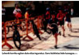
Lehenik korrika eginen dute elizta inguratuz. Gero bizkitatz bide luzeagoa. 12:00z

Astasu ▸ Mus txapelketa, pallazoen ikuskizuna eta musikaz gozatu zuten atzo Elizmendiko auzoan, gaur ere musika izango dute.