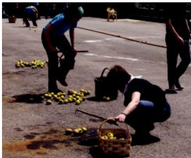
Asteasun duatloian helmugaratzeko metro gutxira; Orexan, berriz, apustuko probetako bat kiskilarekin sagarrak biltzea izan zen.