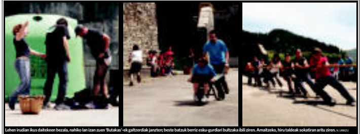
Lehen indian ikus daitekeen bezala, nahiko lan izan zuen 'Bulakak' ek gaitzerdik jantzeri, beste batzuk berriz esku-gurdari burutako ibili ziren. Amaitzeko, hiru taldeak sokotiran aritu ziren. 12:00z