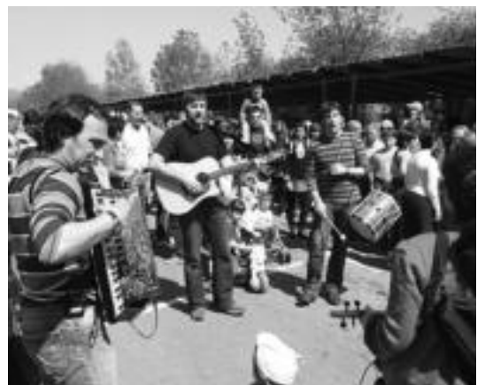
Bentazaharreko Mutil Alaiak taldekoek girotu zuten goiza. M. DEL OLMO