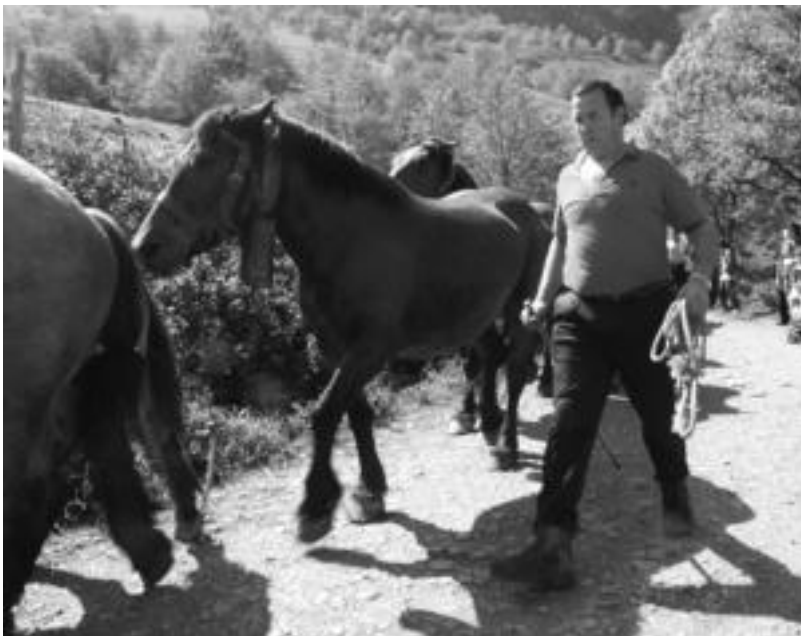
Aralarreko larreetan animalia ugari ibili zen atzo; adibidez, honako zaldi hauek. M. DEL OLMO