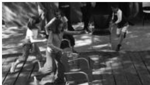
Atzo haurrekin egindako jolasen artean, aulki dantzan aritu ziren. NEREA URBIZU

Atzo ume-jolasak egin zituzten umeekin. Kalejiran gaztetxera jeitsi ziren. Gauean, berriz, bideo-emanaldia izan zen.