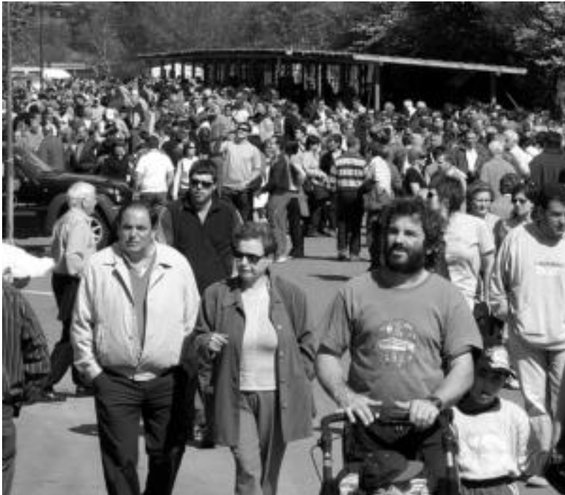
Jende asko inguratu zen atzo Larraitzera, goizean goizetik, eguraldia lagun. MAIDER DEL OLMO