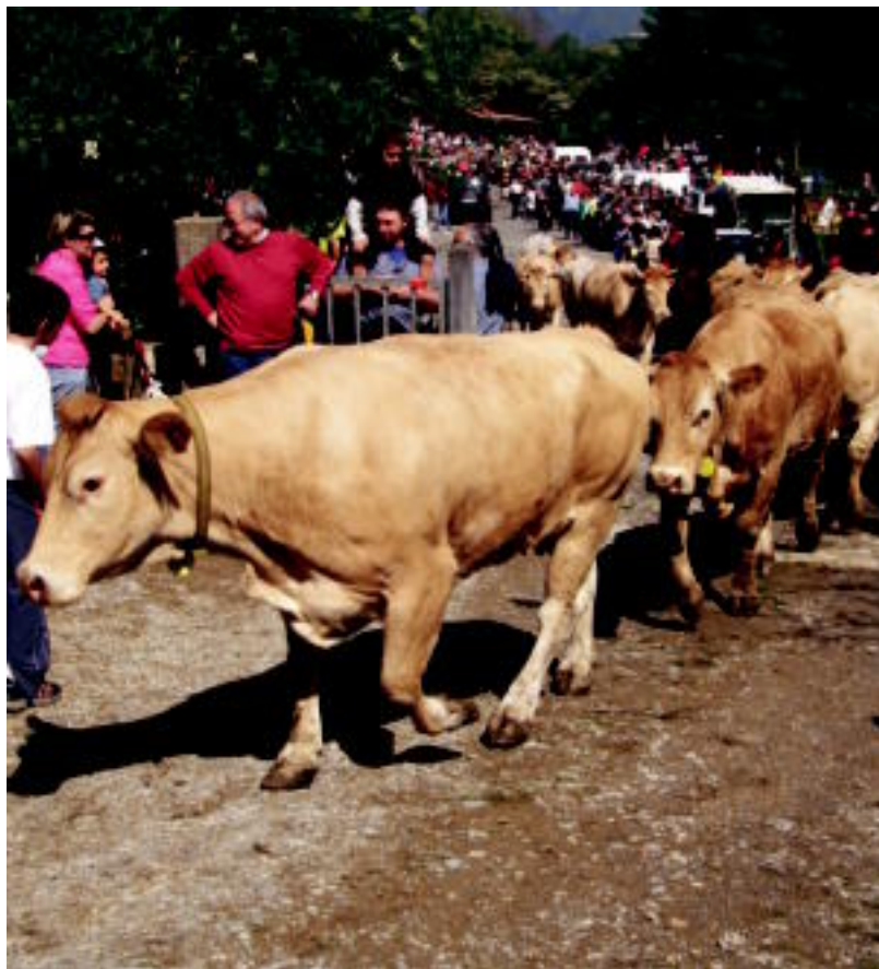
Ganadua larreetara eraman zuten atzo Larraitzen, jendetzaren aurrean eta jai giroan.

TOLOSA Tolosar jatorria dute biek; euskara ikasten ari dira Maizpide euskaltegian 4-5