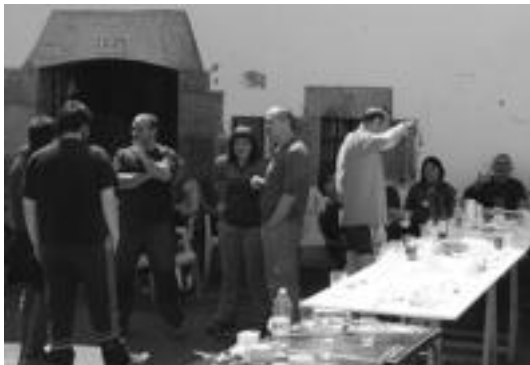
Mendi ibilaldiaren ondoren hamaiketako eta solasaldia izan zuten. ESTI EZEIZA