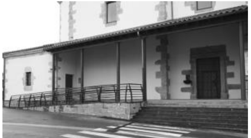
Elizarrak, eskalieretatik nahiz aldapan gora igo daitezke elizara. A. OTERMIN