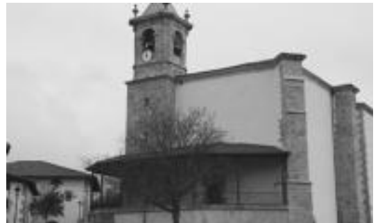
Dorreak eta kanpoaldeak, bestelako itxura erakusten dute. A. OTERMIN

Carrerak, Orendaingo elizaz gain, Tolosako Andre Mariaren elizako bi dorretxeak eta kanpandorra, eta Ibarra eliza eta zubia egin zituen; ondare bat baino gehiago utzi zituen bailaran.