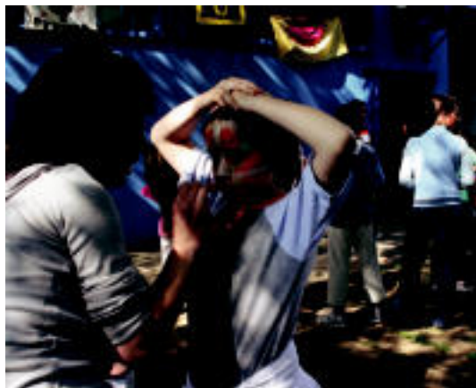
Atzoko jolasetan, aurpegiak margotu zizkieten gaztetxoek. N. URBIZU

IGOERA «Uste baino luzeagoa eta gogorragoa» izan zela aitortu dute; «haizeak ere gogor jotzen zuen» 6