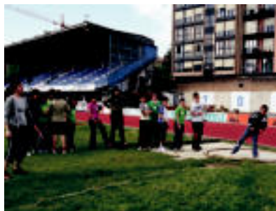
Pisu jaurtiketan, esku pilotan, erreleboetan eta sokatiran aritu ziren, besteak beste, gaztetxoak. ESTI EZEIZA