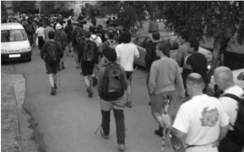
Berastegitik 07:00etan irtengo dira mendizaleak, inguruko larre eta basoetan barrena Leitzaran ezagutzuz. JOXEMI SAIZAR