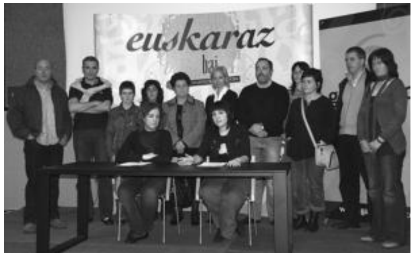
Ekimenaren aurkezpenean, antolatzaileekin batera izan ziren eskualdeko hainbat Udal ordezkari, euskara teknikari. E. E.

Beraz, jardunaldi interesgarria, eta aldi berean, ikusgarria izan zen asteburukoak. Jende ugari bildu zen, kiroldegiko aretoetako batean zeuden 20 mahaietan zer gertatzen zen ikusteko.