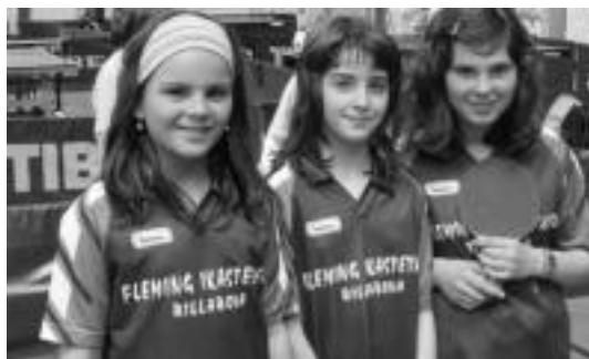
Villabonako jokalaririk hirugarren geratu ziren txapelketan. HITZA