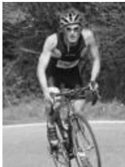
Sarasola, bizikletakoan bikain. HITZA

Triatloia » Hurrengo hitzordua Senpereko izango dute eskualdekoek; denboraldiko lehen triatloia izango da.