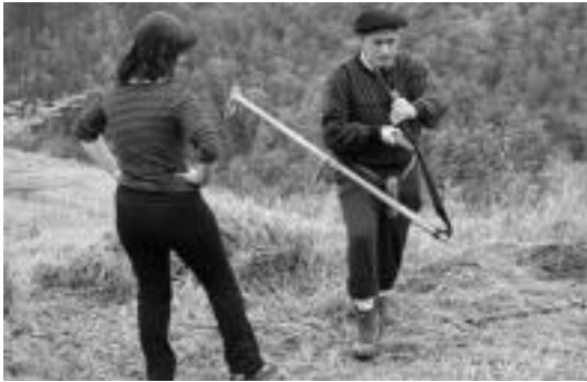
Aurten sega probarik ez da egongo baina bai Goitibehera txapelketa. N. URBIZU