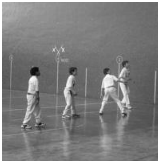
8 partida jokatu zituzten larunbatean Amazabal Pilotalekuan. N. GARZIA

Nafar Jokoei dagokienez, 10 norgehiagoka jokatu zituzten, horietatik 8, Amazabalen eta hauetatik 4 irabazi eta 4 galdu zituzten. Altxelaik eta Illarregik Errekaren aurka galdu zuten, Gilek eta Saralegik, Zugarralderen aurka, Sagastibeltza Eguesek eta Igartuak Oberearen aurka eta Olanok eta Aldaregiak Uharteren aurka.