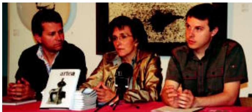
Goian, Oteizaren Euskal Zentauroa eskultura. Behean, Bildarratz, Apalategi eta Arellano, atzoko aurkezpenean. I. GARCIA