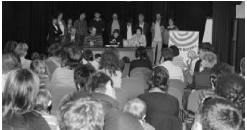
Haur Eskola eta Ikastolako Errektore Kontseiluetako gurasoek herritar ugari babesa izan zuten atzo. ASIER IMAZ