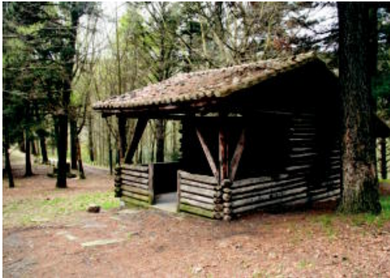
Sagastigaineta aterpea Langurre parkean dago, haurren parketik gorago: atzean trastelektuko bat dauka. N. URBIZU

«Langurreko atzealdea garbitzen hasi ginen, baserriak dauden parreraino, alegia». Diputazioarekin orduko alkateak hitz egin zuen eta erabaki zuten txabola edo aterpetxo bat egitea, Sagastigaineta, hain zuzen. Atzeko aldean biltegi txiki bat ere egin zioten: «Orduan suteak izaten zirenerako oinarritzeko tresneria, mendirako motoze-