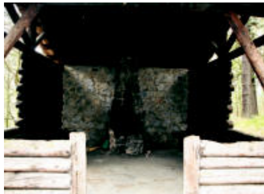
Aterpean beheko sua dago, eta parrilla txiki bat. Ongi babestuta dago. N. URBIZU