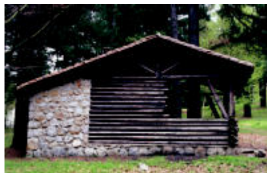
Aldaba Txikiko mendian dago Langaurreko parkea. N.U.

IBARRA Gaur izango da, 17:30ean, herriko plazan; parte hartzeko eskatu diete herritarrei 6