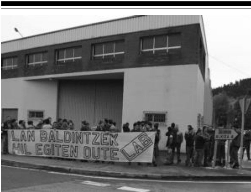
LABen deialdiari erantzunez, Asteasuko industriagunean langile ugari elkartu ziren. ASIER IMAZ