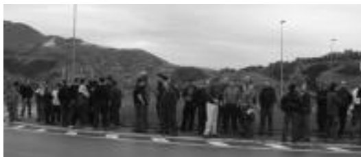
Apatta-Errekan ordubeteko lanuztea egin zuten langileek. ASIER IMAZ

Ekonomia » LABen esanetan «erantzun zabala» izan zuen deialdiak eskualdeko lantegietan atzokoan.