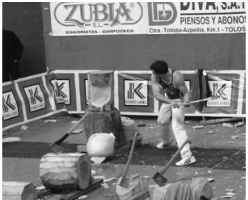
Zutikako lanean Rekondok 6 segundo atera zizkion Arriari larunbatean.

Lehenengoek 120 euro eskuratu zituzten, bigarrenek 80 euro eta hirugarrenek 60 euro.