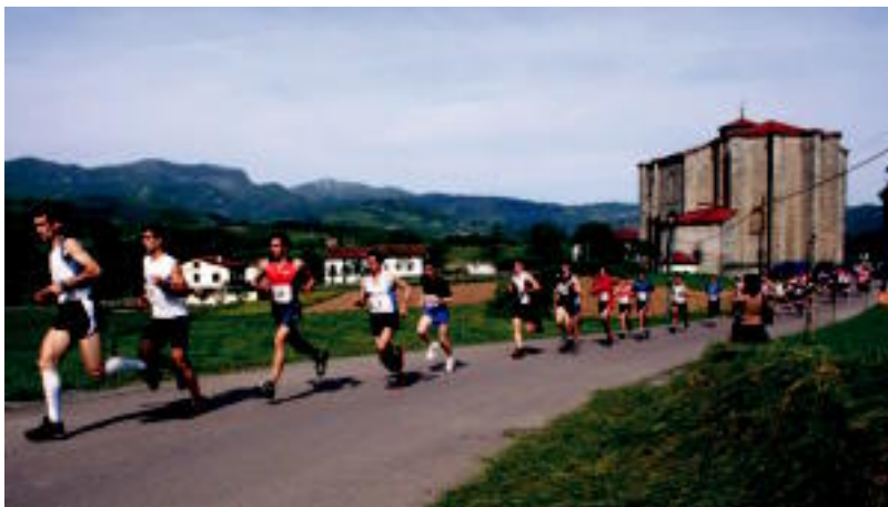
Korrikalariak lanean herenegun Amasa inguruan; Garin irabazlea laugarren postuan doa. ANDER OTEZABAL