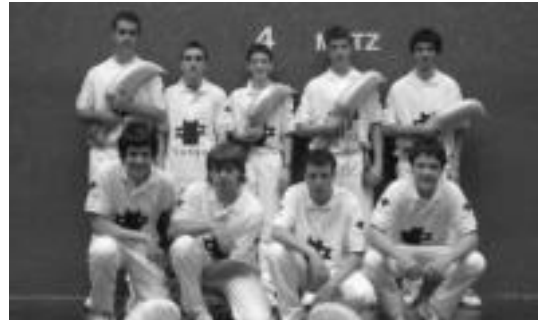
Beotibar Zesta Punta taldeko kideak Beotibarren, joan den igandean.

■ Kamara. Igaratzatik minetarako idean argazki kamara bat galduten igandean. Canon Ixus 60. Aurkituz gero telef: 66057914.