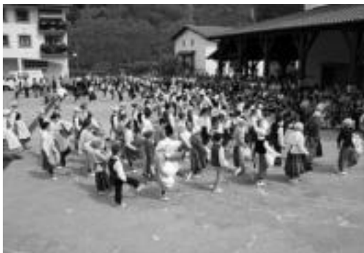
Eskualdeko dantzariak elkarrekin dantzatu zuten. A. OTEZABAL

Rekondori dagokionez, «oso ongi» aritu zela dio Astibia, izan ere, saioa hasi aurretik gehienek Arriak irabaziko zuela pentsatzen zuten. «Rekondo inoiz baino hobeto ikusi nuen». Datorren larunbatean 2 aizkolariek elkarren aurka jokatu beharko dute berriro, final-laurdenetarako zein sailkatzen den erabakitzeke.