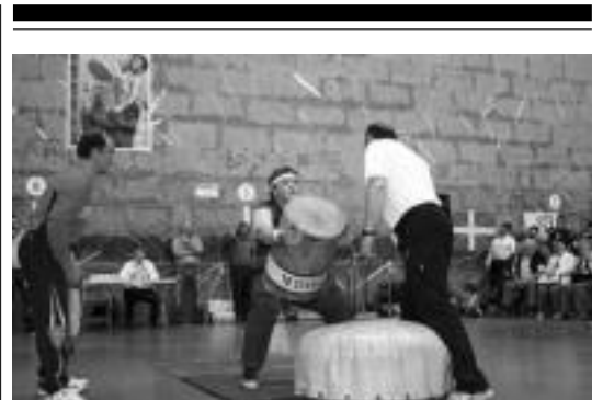
208 kiloko Gorostidi Harria bederlatzi aldiz berdin duen Irigoienek. A. OTEZABAL

LABek zabaldu dituen datuetan aipagarrienak ondoren: «Emusin tailer osoa geratu da, 45 langile bildu direlarik; Unipapelen 45 langile irten dira; Asteasuko industriagunean 60 langile, Echesa, Bost, Leibi eta Sodesatik; Apatta-Errekan 40, Voith, Gorostidi eta Oker enpresetako langileak; S.A.M. en 40; Insuluzen 25; Villabonako Udalan 18; Zizurkilgo Udalan 15; Tolosako Udalan 25; Ibarako Udalan 9 langile irten dira eta Endakin 24, Komiteak deituta, bertan ELAko ordezkariek daude».