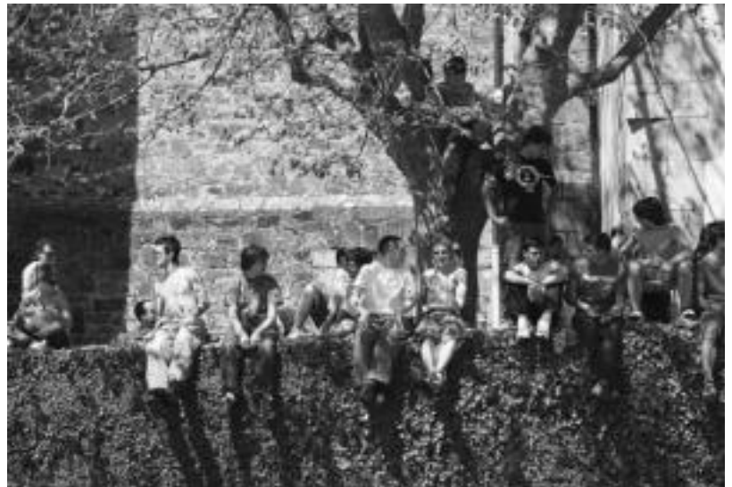
Giro bikaina zegoen errepidearen inguruan; irdudian Abaltzisketako herrigunea. NEREA URBIZU

Antolakuntzan aritu zirenek lan fina egin zuten, ibilbidea ondo markatuta eta gutzia ondo zuzendurik egon baitzen une oro. Rallyaren bideoak eskualdeko egunkariaren webgunean daude ikusgai: www.tolosaldeko-hitza.info .