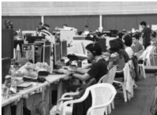
600 lagun bildu dira Usabal kiroledegian, informatika topaketan. ESTI EZEIZA

Gizartea » Goizean goiz hasi eta gauerdia arte ibili dira nabigatzen Gipuzkoa Encounterreko parte-hartzaileak.