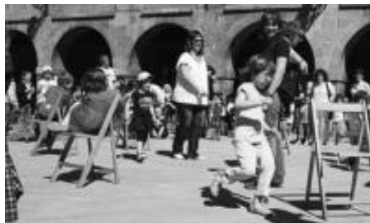
Irudian, plazan aulki dantzan jolasten. N. URBIZU

Hemen gaudenetatik, gehienok diseinuaren sektorean egiten dugu lan, edo harremana dugu horrekin. Hala, oraindik ere, sail horretan lan egiten dutenetan, gehienak gizonetzkoak dira. Hala ere, gero eta emakume gehiago ari dira sartzen teknologian munduan, nahiz eta gutxiengo izan egun.