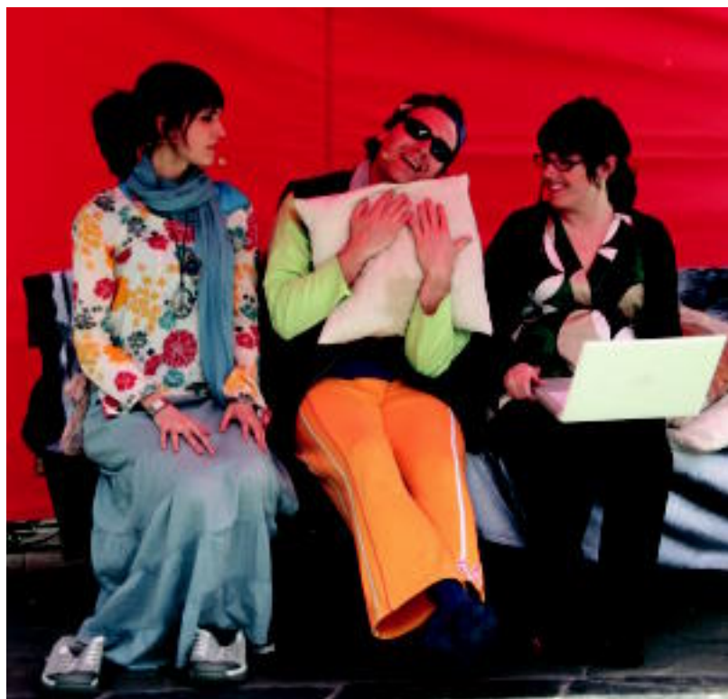
Antzerki emanaldia izan zen atzo egun osoan ikusgai Trianguloan, Interneti buruz. E. EZBIZA

BERAZUBI «Futbolarekin harremanetan jarri ninduen lehen lekua da, nire haurtzaroko ikonoa», dio 2