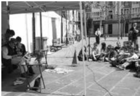
Triangulon ikusgai den antzerkiaren uneetako bat. ESTI EZEIZA

Internet Eskolan denbora pasatzeko hainbat aukera daude. Alde batetik, bideojoku berrienetan jolasteko aukera dago. Bestetik, nabigatzeko 70 ordenagailu daude