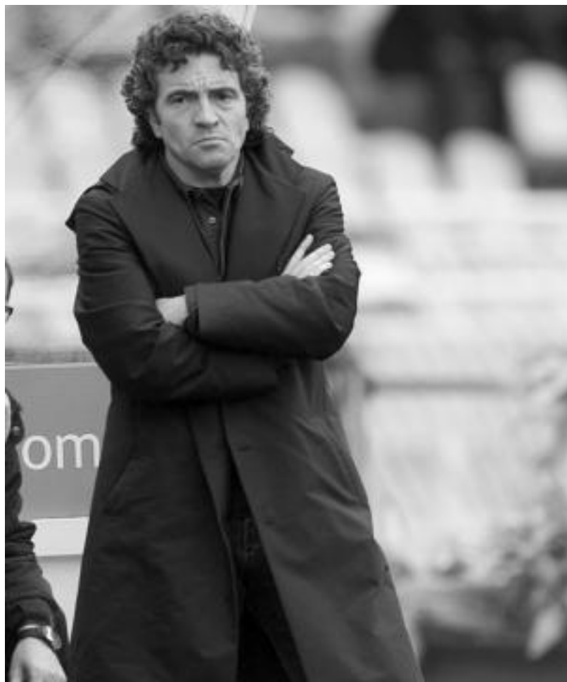
JUAN CARLOS RUIZ / ARGAZKI PRESS