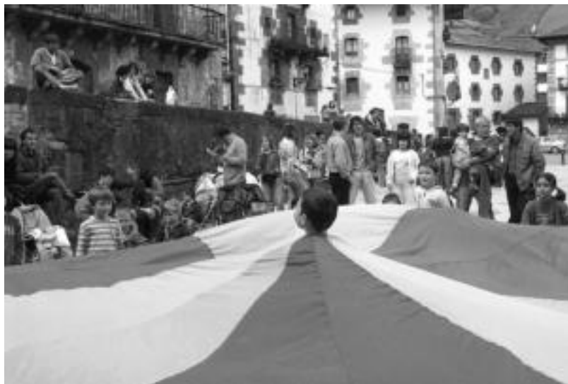
Irakasleek eta gurasoek ere parte hartu arren, haurrak izanen dira protagonistak aurreko urteetan bezalaxe. I. T.

Horretarako 11:00etan plazan elkartuko dira, eta 12:30ak bitarte betiko jokoekin jolasean ariko dira. 12:30etik 13:00etara Aresoko eta Leitza dantzari txikiak erakustaldia egingen dute, eta 13:00etan Goizueta dantzariak Zagi Dantza dantzatuko dute herrian barrena.