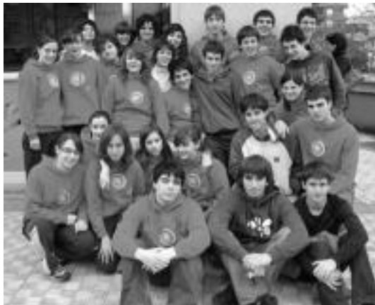
Denera Tolosaldea Igeriketa Taldeko 15 igerilariak hartu zuten parte. HITZA

Nabarmentzekoa da ondorengo igerilariak egindako lana. Alde ba-