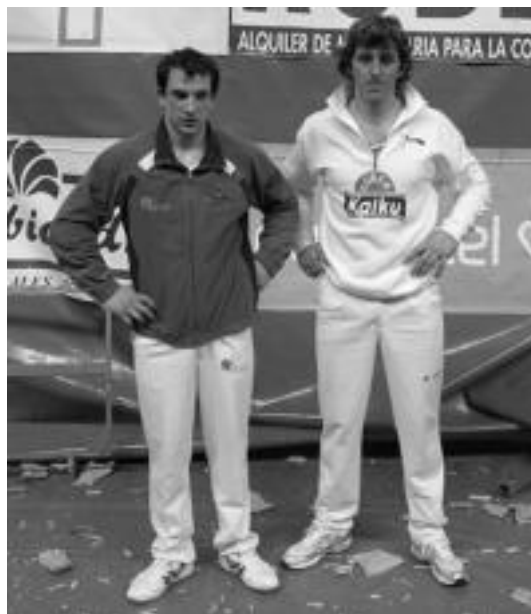
Rekondo eta Arria V.a elkarren aurka ariko dira. N. GARZIA

Bai Arria V.a, bai Rekondo joan den asteazkenetik ziren txapelketan, nahiz eta joan den larunbateko txapelketako bosgarren koxka izan. Halere, biak irabazle suertatu ziren, Arria V.ak Lasari irabazi on-