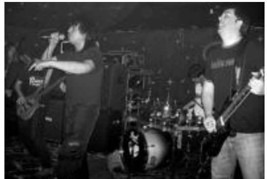
Kautiko taldeak joko du, beste zenbait talderekin batera. HITZA

Gazte NafaRock-ek 2 urte beteko ditu bihar Leitza eta antolatzaileek urtetik urtera egiteko asmoa azaldu dute Nafarroako leku ezberdinetan, gazteentzako urtero errepikatuko den bilgune finko batean bihurtu dadin, betiere, filosofia eta borroka eremu horiek musikarekin uztartuz.