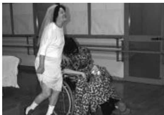
'La sed' antzezlanean aktoreak Tolosako antzerki tailerlean. JERONIMO OTEGI

Iberiar Penintsulan zehar autoz eginiko bidaia da, izenaren arabera aukeraturiko herrietan barrena. Astra tour lana bi piezek osatzen dute: bideo-instalazioa eta performancea. Bi pantailen gaineko proiektzio sinkrono eta jarraituak osatzen du bideo-instalazioa. Eszenan gorputza eta haren jarduerak dira gertatzen den guztiaren lotura, eta herrien izenek baino ez dituzte ematen ibilbidearen berri.