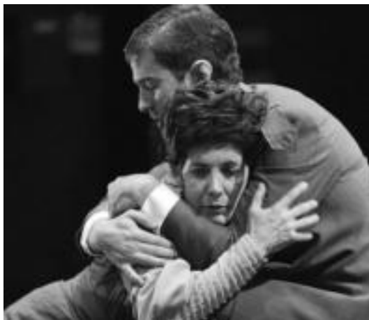
Leidorren ikusi ahalko den 'Antigona' antzezlaneko une bat. HITZA

■ 10:00etan hasita, Beotibar frontoian Herri Arteko Zesta Punta txapelketako partidak jokatu dira.