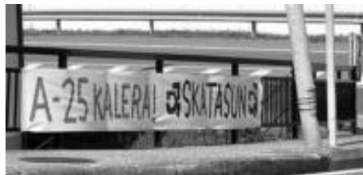
AMMren esanetan argazkiko pankarta jartzen ari ziren 2 gazteak. HITZA

■ Iturgina. Iturgin lanetarako pertsona behar dugu. 685 22 70 58.