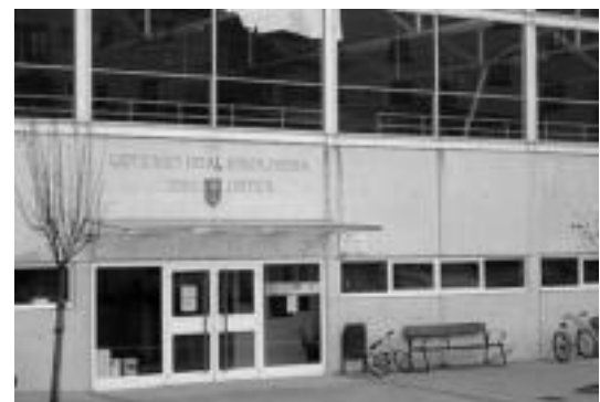
Kiroldegian egingen dute ekitaldiak eta kontzertuak ere bertan izanen dira. N.G.