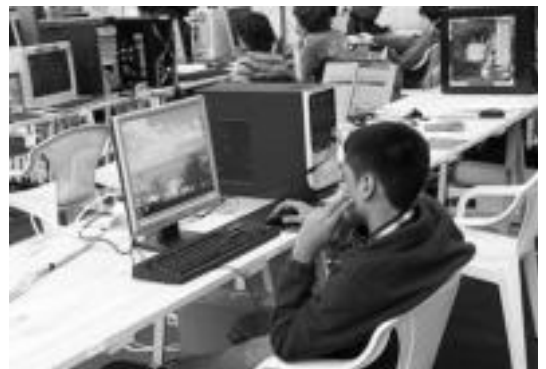
Pasa den urteko Gipuzkoa Encounter jaialdiko une bat. I.

Hirugarren sailkapenean, pasaden astean, Autoeskuela taldeak jaso zuen epaimahiaren bozka. Bestalde, Irri makila taldeak «euren umorearengatik» ikusleen boztoa eman zuen.