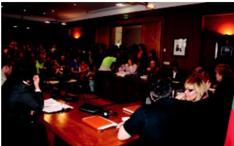
Bete egin zen herenegun udaletxeko batzar aretoa; herritarrek erabakiarekin ez daudela ados adierazi zuten.

ERANTZUNA Desadostasuna adierazteko 150 lagun inguru elkartu ziren; bihar elkarretaratzea egingo dute