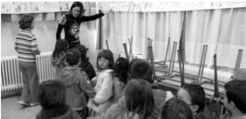
Haur-hezkuntzako umeek egindako marrazkiak ere ikusgai jarri zituzten jantokian. N. GARZIA