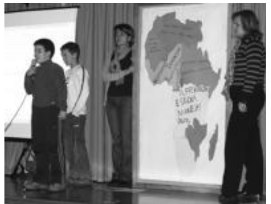
Afrikako puzzlea hezkuntzaren aldeko esaldiez bete ondoren, bertsoan. N. G.