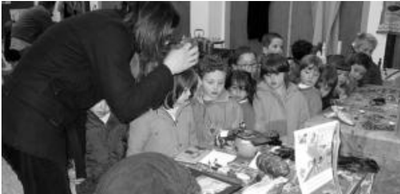
Ikasleek etxetik emandako gauzeekin erakusketa hagitz oparoa antolatu zuten. N. GARZIA