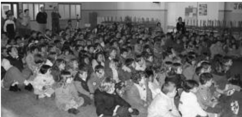
Afrikako argazkiak eta Filipinetako marrazki bizidunetako film bat ere bota zuten. N. GARZIA