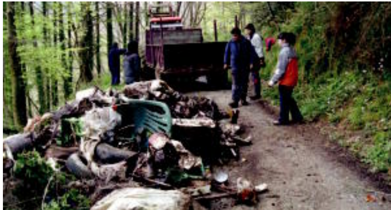
Igandean aritu ziren mendiak garbitzen Berastegiko 16 herritar.

Vespa moto zahar bat, sukaldia, garbigailua, mikrouhina, berogailua, hozkailua, kamioi gurrpilak,