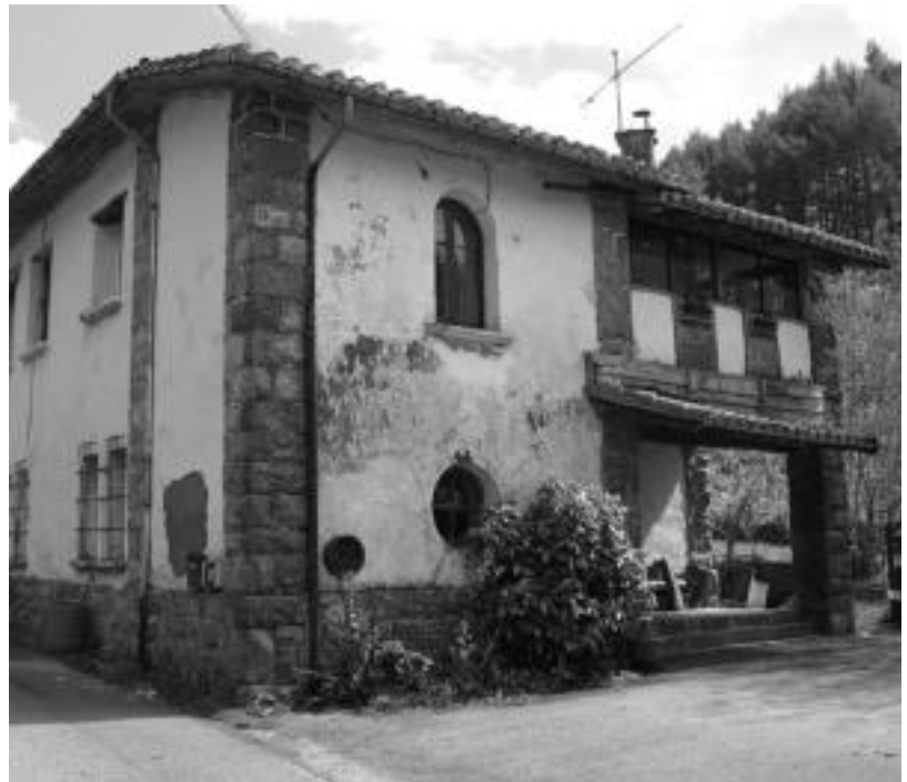
Eskola izeneko etxean, Tutenean eta Barunen bezalaxe, ez dute ETB ongi ikusten. N. GARZIA

aren inguruan ere bere kezka azaldu ditu. «Beste kontua da TDT deitzen den hori jartzen bada, gu nola gelditzen garen. Orain arte ez dugu inongo hobekuntzarik, utzita egondu gara kristoren denbora pilean eta ez dakigu gerora zer gertatuko den. Suposatzen da esanen dugutela nahitaez behar dugula hargailu txiki bat, beste herriko etxeetan bezalaxe, halere ez dakit horrek arazoa konponduko luke-