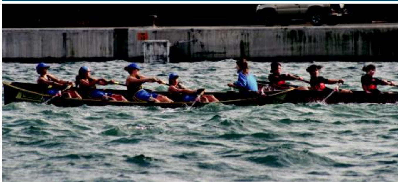
TAKeko neskak igandeko saioan, Pasaian. m.o.

ERAGINA Udalaren funtzionamenduan nahiz arlo pribatuan nabariturako dituzte ondorioak herritarrek 2