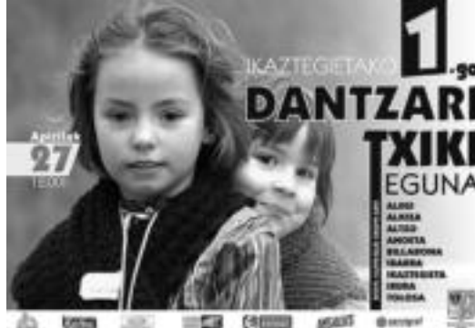
Ikaztegieta Dantzari Txiki eguna iragartzeko kartela. HITZA

10:30a aldera autobusetan dantzari txiki guztiak elkartzeko dira kiroldegian, eta kalejiran plazaraino joango dira, trikitalari eta txistularien laguntzaz. Bertan, ondoren, hamaiketako izango da. «Gurasoek ere jatekoak eta edatekoak izango dituzte prestatuko dugun barra