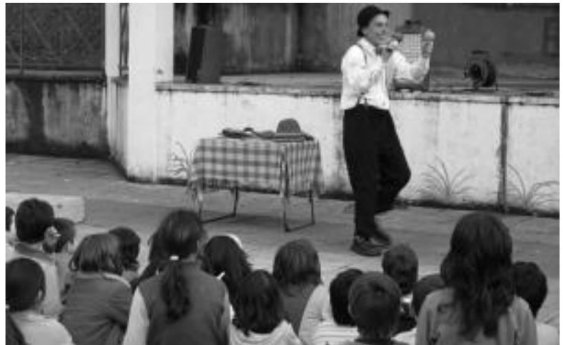
Arturrelo di Popoloren emanaldia Antzerki Astearen baitan. HITZA

Eraikiko diren etxebizitzetatik zazpi 3 gela eta 2 bainu izango dituzte; berrogeik, 2 gela eta bainu bat; eta bik, gela bat eta bainu bat. Azken bi hauek 40 m 2 ingurukoak izango dira eta gainontzekoak, 57 eta 81 m 2 artekoak. Aipatu 49 etxebizitza hauetatik bi ezinduak diren pertsonaie esleitzeko prestatuak daude. Jabetza erregimenean erosten dira etxebizitzak eta salmenta prezioak legeak ezartzen dituenak izango dira. Etxebizitzarekin batera ezinbestean garaje ireki bat erosi beharko da.