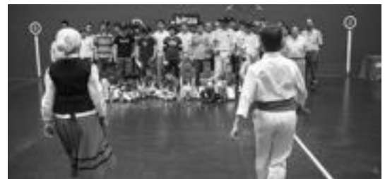
Txapelketa ekainaren erdialdera bukatzen da, Beotibarren. I. TERRADILLOS

Sei mailatako finalak, partidaren errespetatuz gero, ekainaren erdialdean jokatuko dira dagokion pilotalekuan. Sari banaketa, berriz, Beotibarren egingo da, udaletxe ezberdinetako jendearekin eta txapelketako hainbat antolatzaileekin batera.