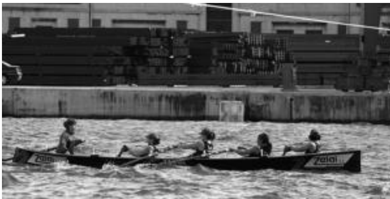
TAKeko senior neskak jaun eta jabe izan ziren larunbatean eta igandean, Euskadiko batelen lehia irabaziz. MIKEL OZAITA