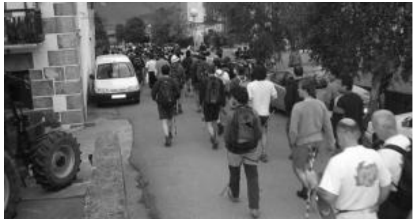
Mendizale ugari bildu ohi da Berastegiko ibilaldi neurtuan. JOXEMI SAIZAR

BERASTEGI • Gaztainondo Jubilatuta Elkarteak egun pasa antolatu du Aldeanueva de Ebroa (Errioxa) apirilaren 24an. Egundateko irteerara joan nahi duenak Gaztainondo elkartearen eman beharko du ize- rna.