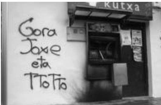
Kutxako kutxazaina kiskalita gelditu da. HITZA

Igandean batez ere haurrei zuzendutako antzezlanak ikusteko aukera izango da Intxaur frontoan. Xurdir eta Gorringo lakuarren misterioa ikusi ahalko da, 17:00etan. Sarrerak 5 euro balioko ditu.