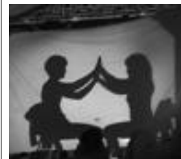
Azken saioaren une bat.

Oso pozik nago, izan ere Tolosarekin sentimentu berezia dut, bai nik bai eta Miguel Delibes de Castro. Urte asko dira jardunaldi hauetan parte hartzen, 15 edo 17. Lagun ugari egin ditugu, eta horregatik berezia da niretzat Tolosa. Herriarekin eta Naturaldiaren antolatzaileekin dugun erlazioa oso berezia da, lagunartekoa. Beraz, etxean bezala sentitzen naiz ni Tolosara joatean.