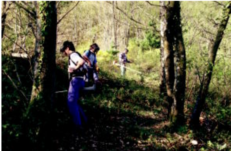
Duela hiru urte Leitzaingo bidea garbitzen aritu ziren Aldin elkarteak. HITZA