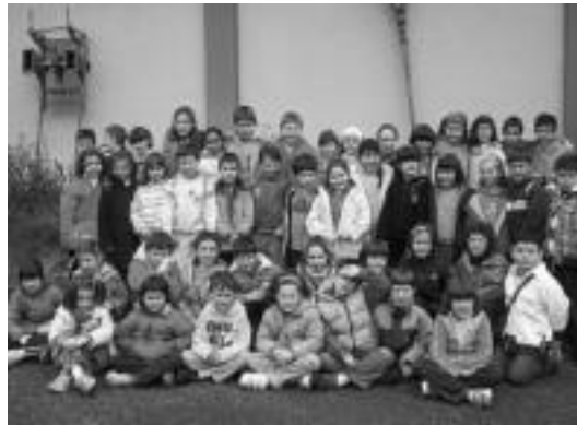
Jesusen Bihotza ikastolako ikasleak.