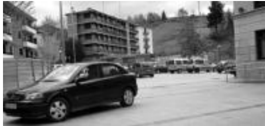
Ibarrako San Bartolome plaza.

Ez dago inongo seinalerik plaza oinezkoentzat bakarrik dela azaltzen denik, eta ezta kotxeentzako lurreko oztoporik ere. Plaza kotxez gainezka daukagu horrek da-