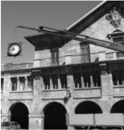
12:00ak aldera hasi ziren erlojua desmuntatzen. N. GARZIA