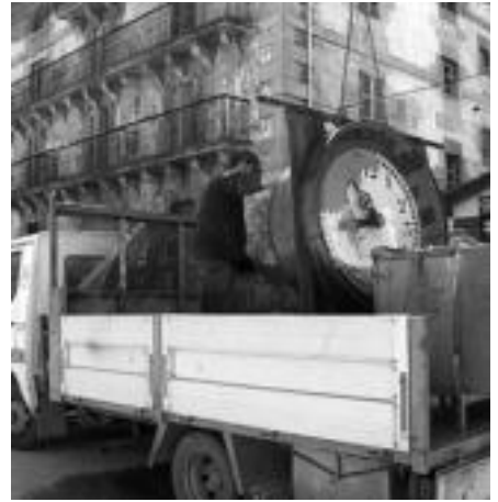
Kamioiean kontuz jarri eta eraman egin zuten. N. GARZIA