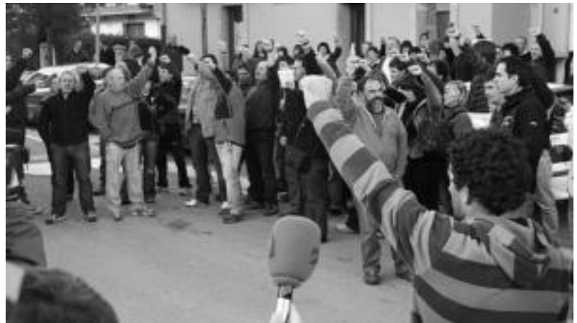
Ezker abertzaleak deitutako elkarretaratzean 90 bat lagun bildu ziren. Erabakiaren ondorengo une bat.

arrazoituta, etaildo horretatik Fernando Grande-Marlaskak beste ikerketa bat martxan jartzea ekarri du, biktimen aurkako delitua ote dagoen aztertzeke.