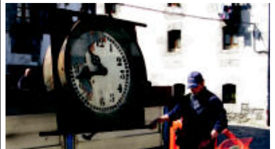
Erloja kendu zuteneko une bat, atzo.

ALTZO Atzo hil zen 39 urterekin; Galtzaundi Euskara Taldeko sortzaileetakoa izan zen z