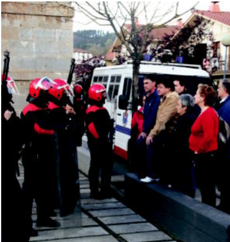
Ezker abertzaleak deituta elkarretaratzea egin zuten ohiko bilkuraren aurretik. Tentsio uneak ere izan ziren. N.U.

SALAKETA Ezker abertzaleak azaldu zuen erabaki horrek «tentsioa pizten» duela, eta «ez du inork irabazten» 6