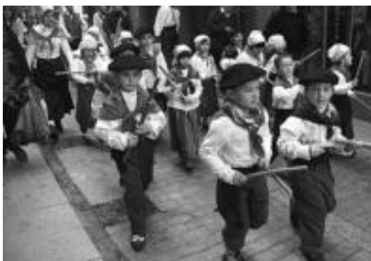
Iaz ere Alde Zaharreko kaleak zeharkatu zituzten dantzari txikiak.

Euria egingo balu goizeko ekitaldiak bertan behera utziko litzukete eta umeentzako jolasak prestatuko dituzte, oraindik zehazteko dagoen lekuan. Arratsaldeko emanaldia, berriz, Plaza Berrian egingo du zerkausian egingo lukete.