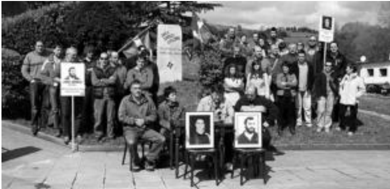
Zizurkilgo ezker abertzalea atzo Joxe Arregi plazan bildu zen izendapen aldaketak ez onartzeko eskatzera. E. EZEIZA