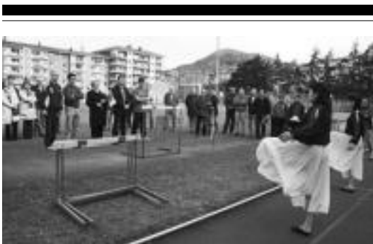
Lacuzaren alargunari opariak ematen atzo Berazubini. E. EZEIZA