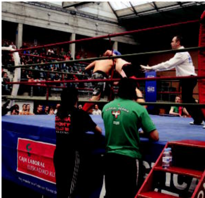
Kick boxing lehiaren une bat, atzo, Olaederra kiroldegian.