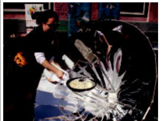
Pilotalekuaren kanpoaldean aritu ziren sukaldatzen. A. IMAZ

VILLABONA ESAITek, Villabonako Udalak eta Bai Euskal Herriarik antolaturiko ekimenean kirola eta aldarrikapena uztartu zituzten 7