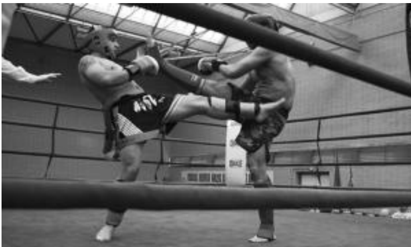
Ukabilak eta oinak ederki astindu zituzten borrokalariak atzo Villabonako Olaederra kiroldegian. A.SIER IMAZ

TOLOSALDEAN • Tolosaldeko Gaztetxe eta Gazte Asanbladetakok kideek antolatutako bizikleta martxa, AHTren aurkako, atzo egin zen eguraldia lagun. Villabonatik 60 bat lagun irten ziren, Anoeta, Tolosa, Alegia eta Tolosan amaitzeko ibilbidea. Bidean Ama lurra defenda dezagun! eta AHTrik ez! oihuak entzun ziren. A.SIER IMAZ