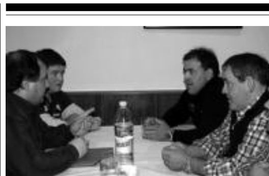
Izeta II.a eta Irigoien, atzo Kantabrikean.

Bere lagunen esanetan, Tolosako kolore urdina alde guztietan defendatu zuen. 20 urteko ibilbide luzea eta oparoa egin zuen atletismoan. Azken lasterketa 42 urte zituela korritu zuen. Baina nabarmenentzako dena da, bere garai-penak ia ustekabean etorri zirela, berezko dohainei esker.