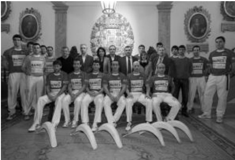
Patxaran Baines Masterraren finalaren partida erabakiorra gaur jokatu dute Galarreta pilotalekuan. HITZA