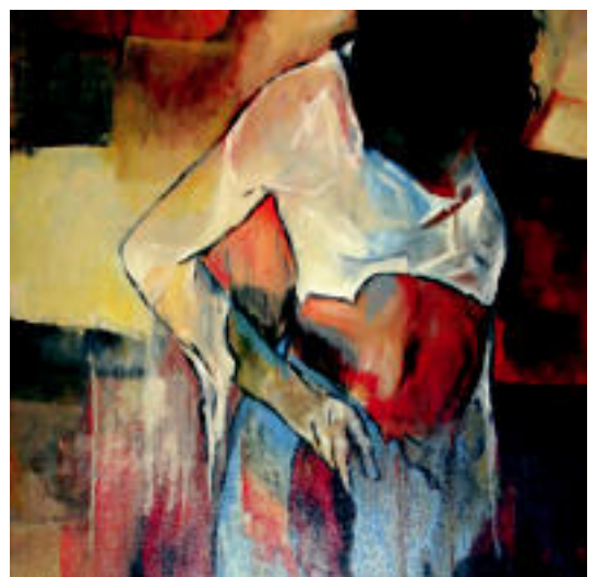
Erretratuak daude ikusgai, besteen artean Alegian. L.A.

Ez daukat zehaztuta, baina baliteke Legorretan izatea nire hurrengo erakusketak. Aranburu jauregian, Lanbroan, Frontonen edota Senperen ere jarri izan ditut nire lanak.