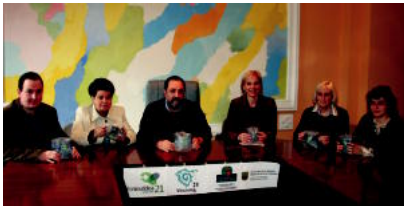
Asteasu, Irura, Anoeta, Zizurkil, Villabona eta Adunako alkateak, atzo kanpainaren aurkezpenean.

GAUR Samaniego eko-eskola bisitatuko dute eta Roberto Ruizek pintxoak prestatuko ditu Eguzkiaren sukaldean 2