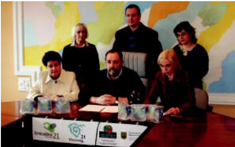
Ernioaldea 21eko sei udalerrietako alkateek prentsaurrekoa eman zuten atzo Anoetako udaletxean.