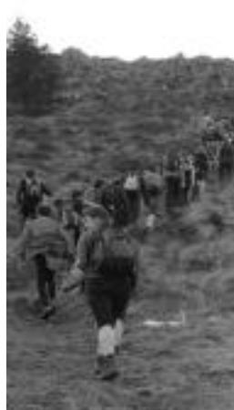
Ibilaldiaren une bat. N.L.

Villabona » Ez da egokia denbora gutxien egin duenari oihartzuna ematea, limitetik kanpo geratu baitzen.