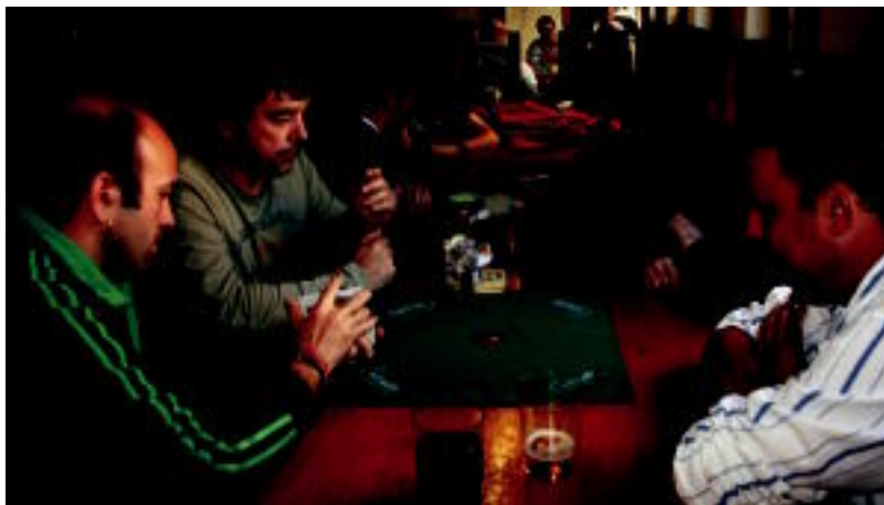
Mus txapelketako irabazleek Tolosako Isastegieta sagardotegian afari bat irabazi zuten.