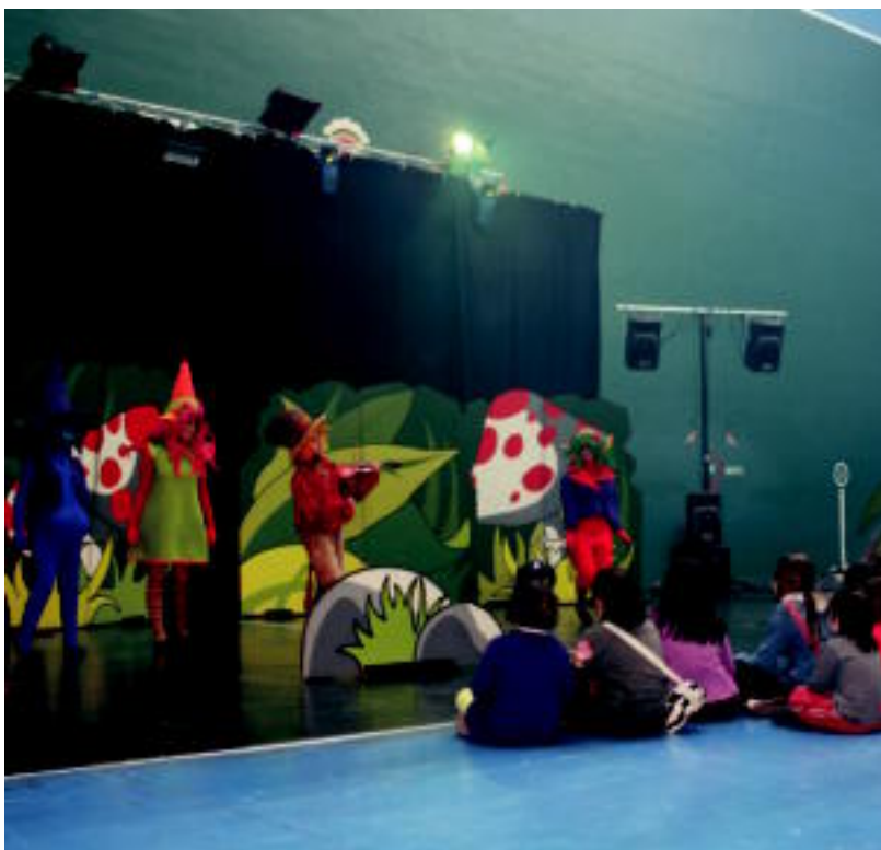
Xurdinen kontzertua izan zen Beotibar pilotalekuan ikusgai.