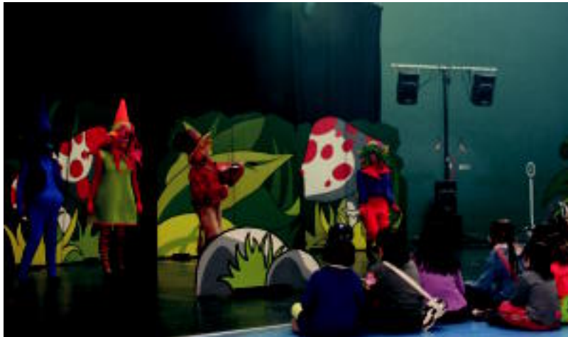
Xurdinen azkeneko lanaz gozatzeko aukera izan zuten atzo umek Beotibar Pilotalekuan.

Parte hartu zuten jokalarjetatik finalera pasa zirenak Jon Zipritia