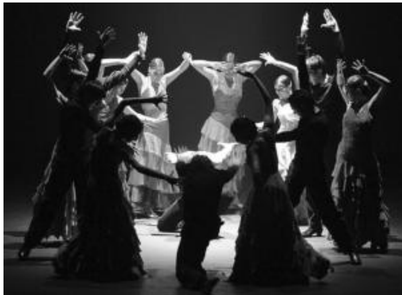
Flamenkoa gustuko duenarentzat hitzordu polita izango da bihar Leidorren. HITZA