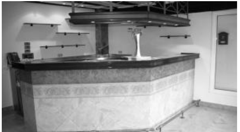
Tabernako barra sarreran dago. Atzealdean sukaldea dauka, eta aurrealdean (eskuinean) ataria. N.U.