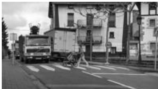
Oinezko bat haur batekin istripua gertatutako zebra bide baten pasatzen.