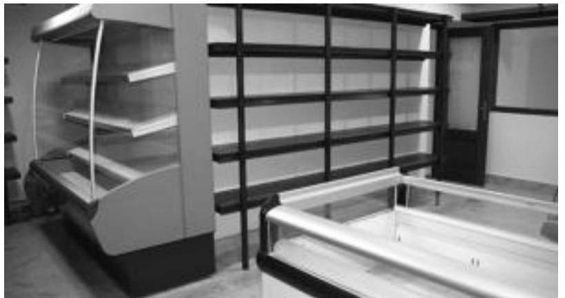
Dendara sartzeko tabernatik igaro behar da. 40 metro koadro inguru ditu eta guztiz hornituta dago. N.U.

Ezinduentzako egokituta dago, aulkientzako aldatxoarekin, besteak beste. Oso argitsua da jantokia, dauzkan leiho handiei esker.