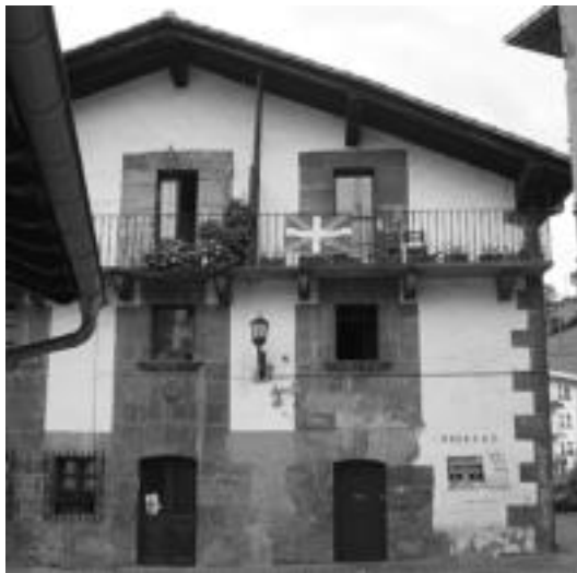
Tailerra Aurreran emanen dute, 2 larunbatetan. N. GARZIA

Mai Etxeberria izanen da bi larunbat hauetan tailerra emanen duena eta antolatzaileek azaldu dutenez, materiala dena berak erama-