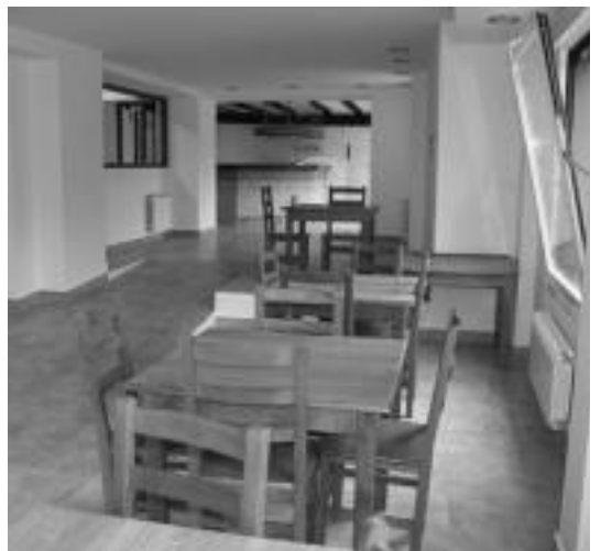
Jangela ederra dauka eta oso argitsua. Guztira, 80 metro koadro. N.U.

Tolosaldea Garatzenek bidaragarritasun plan bat egin zien eta horretan oinarrituta dago dena.