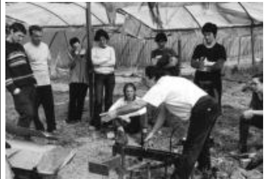
Ikastaro ugari antolatzen dituzte urtero Fraisoron. HITZA

Informazio gehiago jaso nahi izanez gero 943 69 64 50 zenbakira deitubehar da edo txangoak@topagunea.com helbide elektronikora idatzi. Izen-emate epea txango bakoitza burutu beharreko data baino astebete lehenagora arte luzatuko da. Larramendi Bazkunak eskuorriak eman ditu argitara. Hauek, Larramendi Bazkunaren kultur etxeetan eta ohiko informazio-guneetan jaso daitezke.