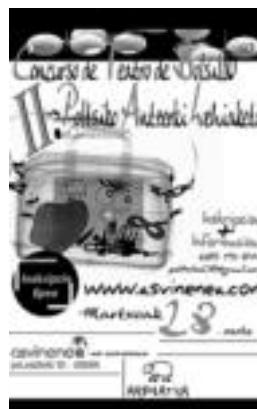
Aurtengo kartela hau da. HITZA

Etxebizitza. Tolosa erdian bilogelako etxea salgai, egoera onean, oso merkea. Interesatuak deitu: 665 70 86 35.