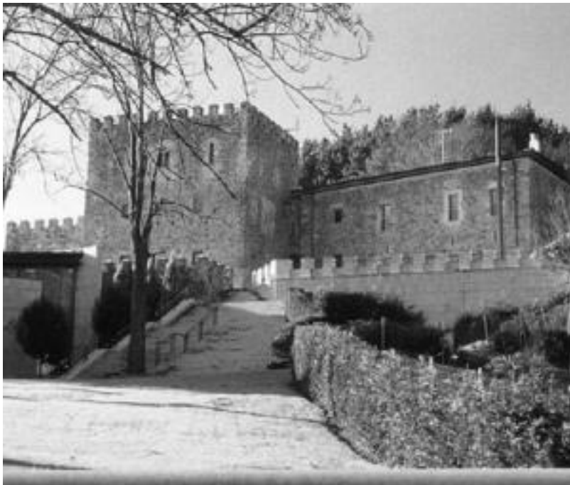
Besteak beste, Avellanedako Juntetxea ikusteko aukera izango dute apirilaren 12an txangoa egiten dutenek. HITZA