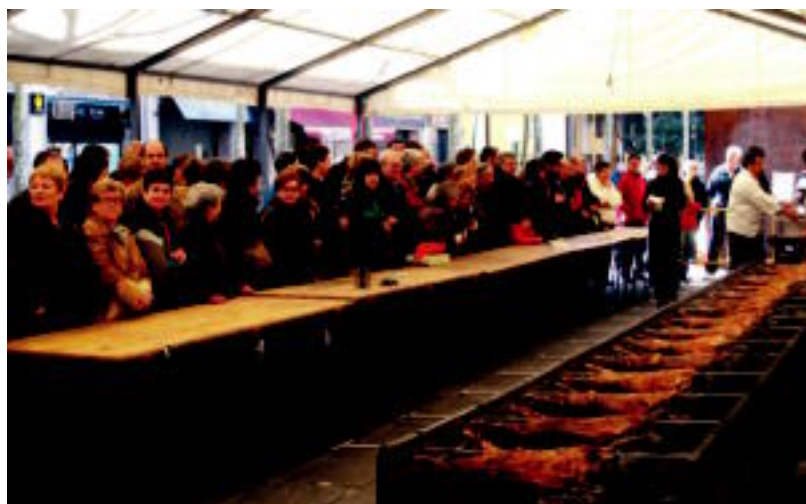
Jendearen aurrean prestatu zuten sukaldariak arkumea Triangulo plazan. HITZA

ARRAZOIA «Berarenganako konfiantza eza» dutela azaldu dute; Ugartek zinegotzi karguan jarraituko du s