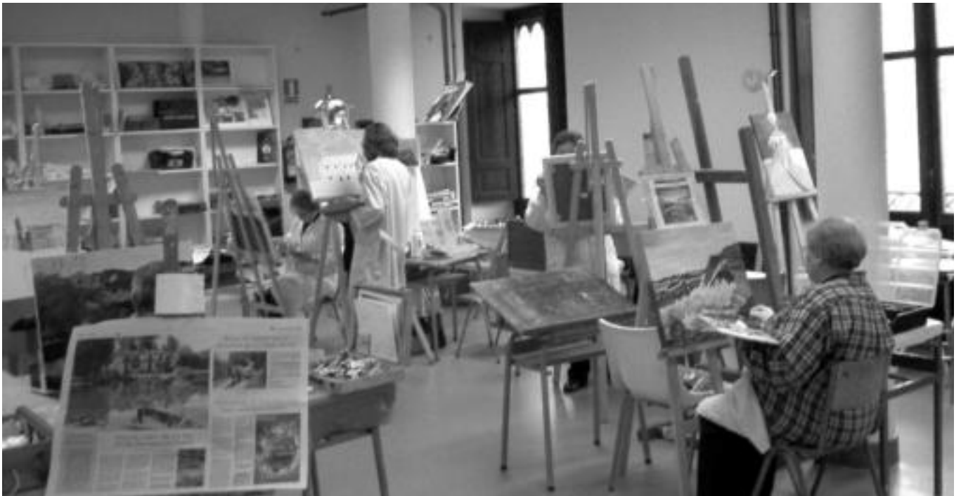
Arratsaldero jende ugari biltzen da Kultur Etxean koadroak margotzeko. HARRIET BELLOSO