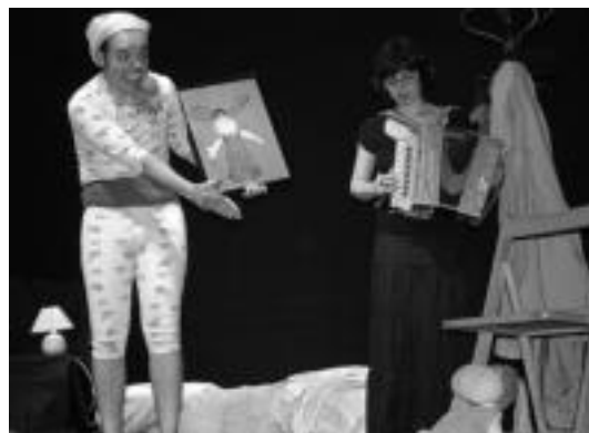
Joan den urteko poltsiko antzerkiko obra bateko une bat. HITZA

Helburuak hauek dira: formatu zabalteko ikuskizunen sustapena eta txabalketa; teknika eszenikoen ikerketa; balore berrien forma-