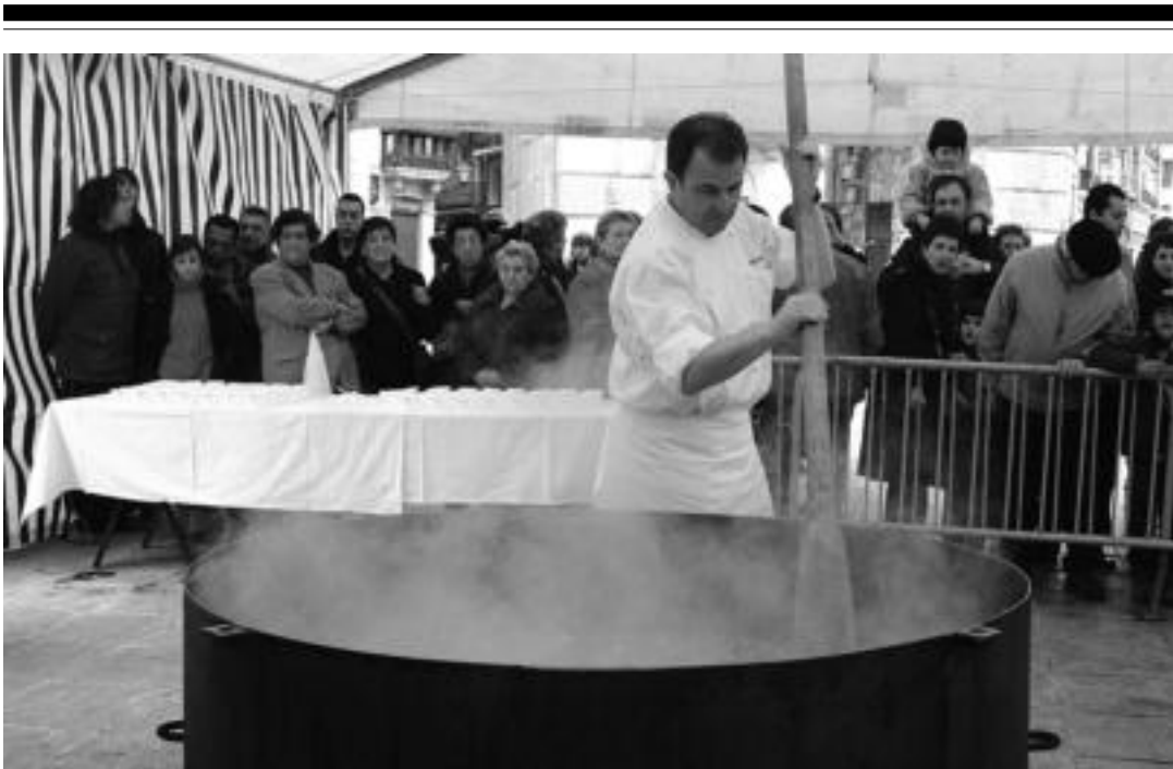
Hamabost arkume hil zituzten Trianguloan, jendearen aurrean, eta ondoren pintxotan jarrita banatu zuten; denera, 1.200. HITZA