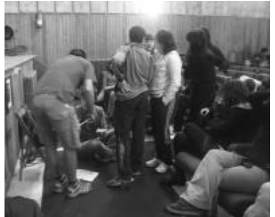
Oholtza azpian musika jartzen aritu ziren, ezinbestekoa baitzen. N. GARZIA