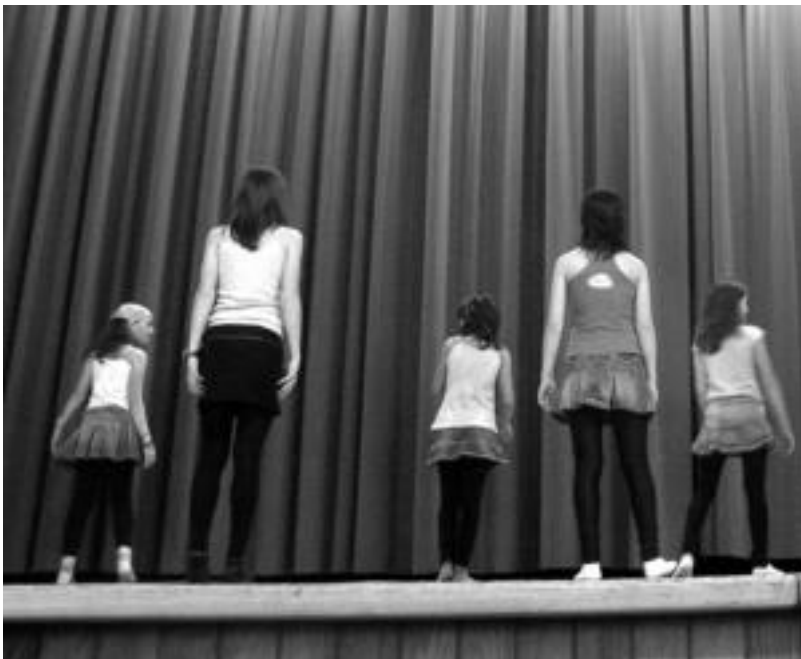
Musika estilo ezberdinak entzun ahal izan ziren, hauek, esaterako, Shakiraren abesti bat aukeratu zuten. N. GARZIA