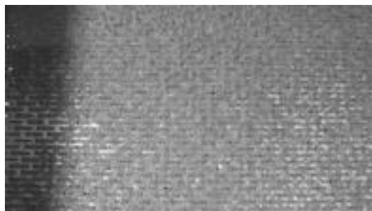
Hauk amuarrain arrautzak dira, gertutik begiak ikusten zaizkie. N. GARZIA