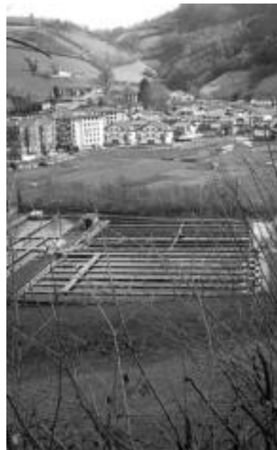
Aska bakoitzean milaka amuarrain daude. N. GARZIA