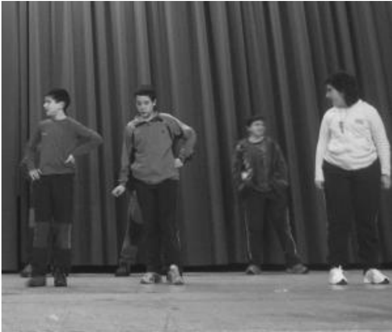
Neskek eta mutilek nahasita dantzatu zuten, hasierako performance-aren ondoren. N. GARZIA