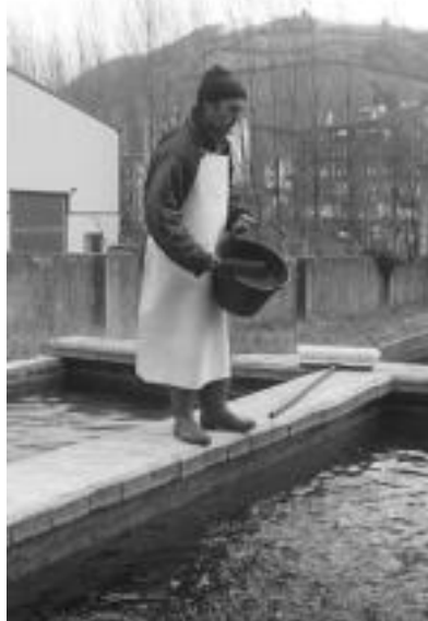
Kanpoko amuarrainei egunero jaten eman behar zaie, N.G.

Arrain-haztegi langileek lana «nahiko gaiean egon beharrekoa» dela diote, «nahiz neguan uholdeak direnean, edo pasoa ixten delako, nahiz udan. Askok herrian esaten digute zuen lanean ederki ibiliko zarete bero handiak egiten dituen uraren ondoan , baina hemen bero handia izaten da. Kanpoan denbora asko igarotzen dugu, eta bai neguan, ba udan, hotza eta beroa, bietatik hartzen dugu».