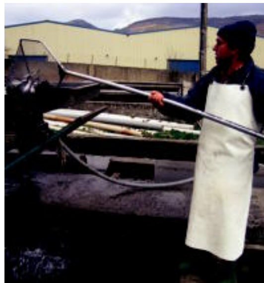
Amuarrainak tamainaren arabera bereizten ditu makinak. N. GARZIA

HERNIALDE Euskal Herriko Txirrindulari Txapelketan 2. egin zuen Hernialdekoak, postu berbera eskuratu zuen Euskal Herriko torneoan 2