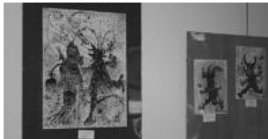
Karetak, eta folklorea lantzen duten lan artistikoak daude ikusgai. N.U.

Irudimen handia dute gazte hauek eta prestakuntza oso ona. Haien tradizioarekin lotutako lanak ikus daitezke, eta baita paisaia europearragoak ere. Merezki dute.