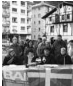
Luloaga, atzoko prentsurrekoan. N.U.

Martxoaren 23an Aberri Eguna izanik, «Euskal Herriko leihoguztiak Ikurrinez eta euskal ikurrez» betetzera animatu zituzten euskal herritarrek. Nazio Eztatidagunearen baitan bilduriko hainbat herritarrek, martxa herritarra an-