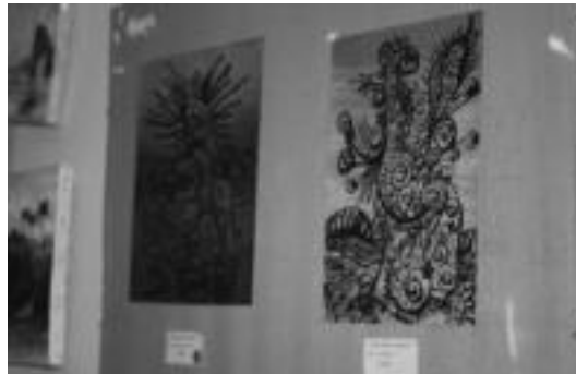
Kolore biziekin egindakoak, Kubako sustraiari lotutakoak daude.