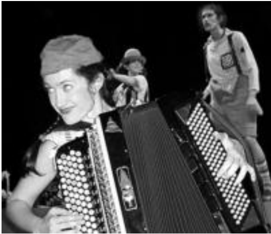
Antzezlaren une bat. HITZA