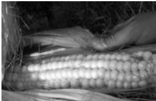
Ez da berdina makrobiotikoa hemen, edo Suitzan izatea, lekuan lekukoa jatea defendatzen baitute. HITZA

«Jendea proteinek in asko kezkatzen da». Makrobiotikoek «noizean behin arraina edo lekaleak jaten ditugu proteinak izateko». Ar-