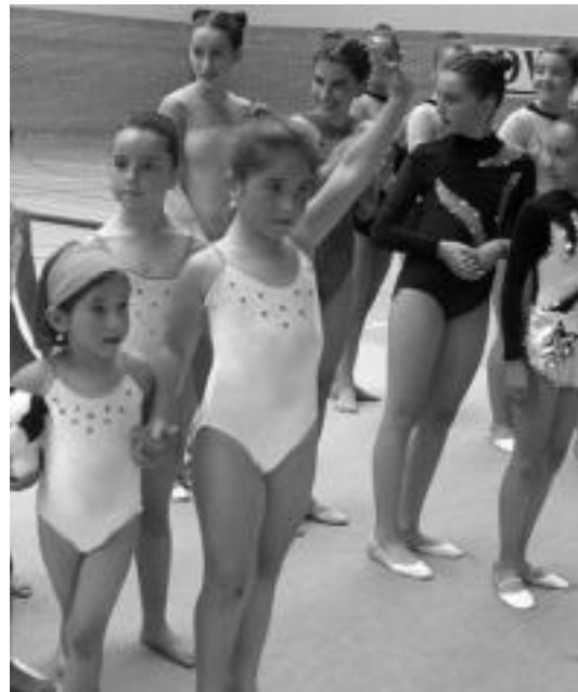
Belabietan gimnastika emanaldi bat, artxiboko irudi batean. HITZA

Antolatzaile lanetan lagun asko ibiliko direla aipatu dute Otsabio KEren kideek, ibilbide motza izan arren azken urteetan lan gehiago eskatzen duelako; bidegurutze, biribilgune eta koskak medio.