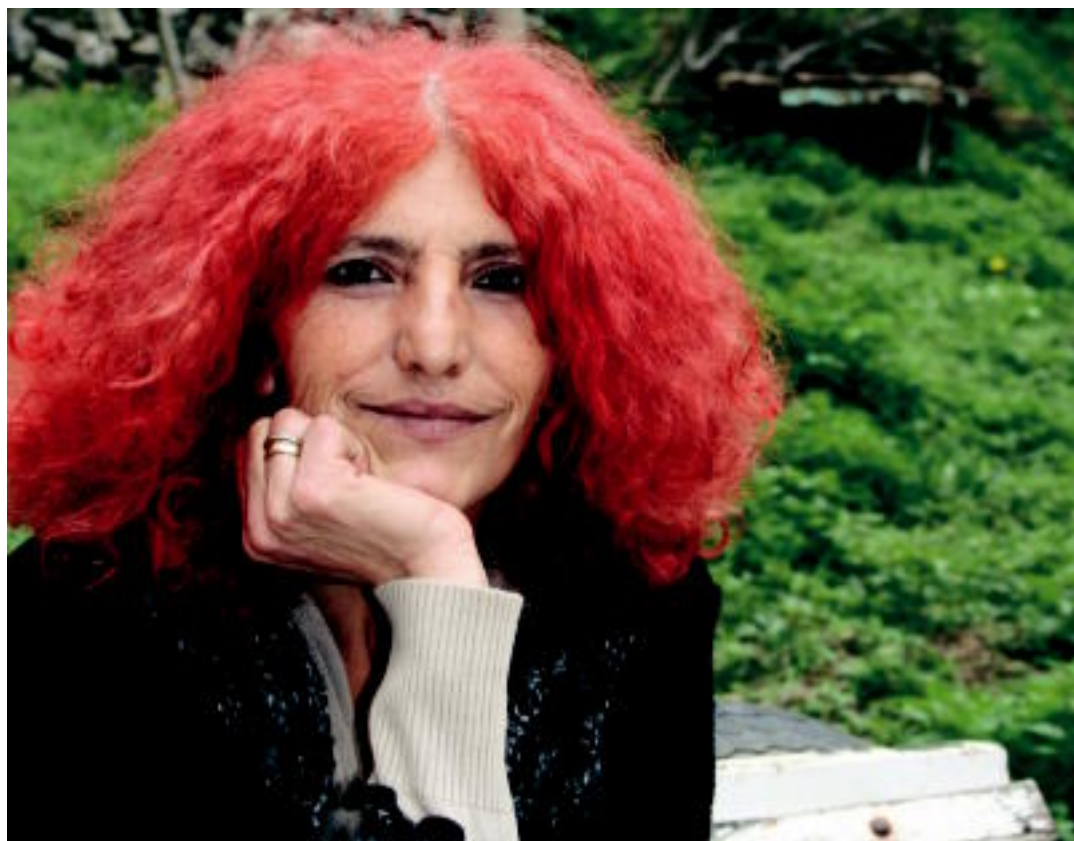
Makrobiotika sukaldaritzari ikastaroa emango du Artachok; «jendea gero eta gehiago kezkatzen da elikaduraz», dio. NEREA URBIZU

HITZORDUA Apirilaren 15-16an Madrilen izango den Espainiako Txapelketan Euskadi ordezkatzeko du 3