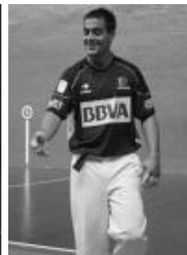
Bi leitzarrentzat finalera sartzea ez da batere erraza izanen. N. LIZARTZA / A. IMAZ