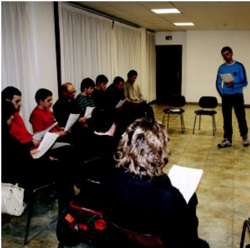
Amezketako balioaitzeko gelan biltzen dira ostegunero bertso eskolako 30 ikasleak, Gorostidirekin batera. N. URBIZU