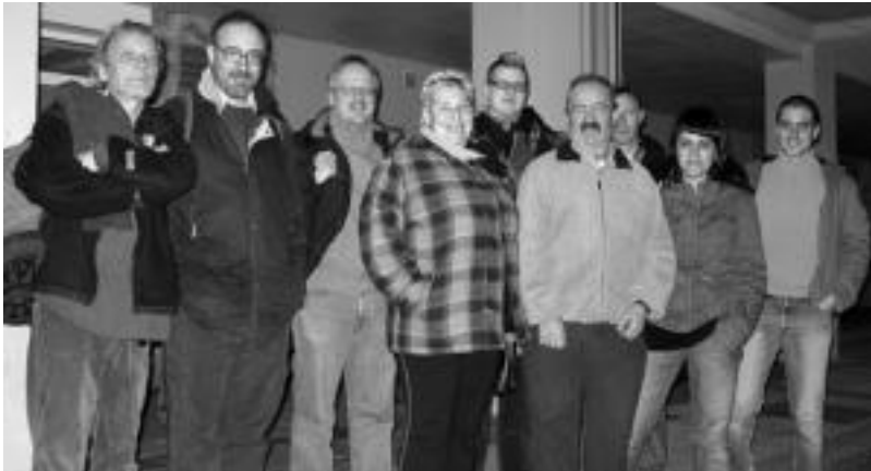
Nazioarteko begirale taldeko zazpi kide herenegun Lizartzan, EAE-ANVren zerrendakideekin batera. A. IMAZ