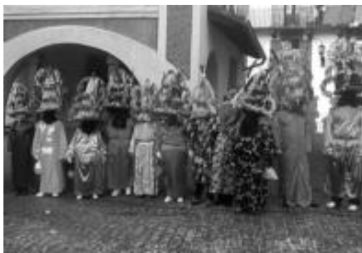
Zenbait herritar atsauretua. A. ARANBURU

Txapelaz gain, mozorroaren beste elementu nagusienetako maskuria izan ohi zen, baina aurtan honen ordez gehienek koloretazko poltsak hartu zituzten. «Maskuri gutxi daude orain. Lehenago txerriak hiltzean jasotzen ziren maskuriak eta orain txerria gero eta gutxiago hiltzen da eta gainera jendeak ez zituen gorde izan. Beharbada hurrengo urtean gehiago izanen dira». Gainera, da-