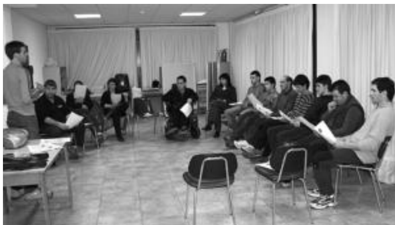
Amezketako balioanitzeko gelan biltzen dira ostegunero, ordu bat inguru. N. URBIZU

Ondo, baina faltan botatzen dit Tolosan bertsoaritzak egonkortzea. Ahalegin hori egin behar dugu, ez da egonkorra, eta iraupe-na izatea nahi nuke. Ametsa, berriaz, Tolosaldeko herri guztietan bertso eskola bat sortzea izango litzateke. Hauetan baliabide falta dago, baina laguntzekin iritsiko gara.