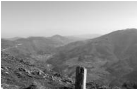
Eszerreko mendikatean, San Lorentzo eta Ipuliño, eta eskubian, Erroizpe. HITZA

Ibilaldi luzeak 2.500 metroko malda izango du orotara eta iraupena 10 ordukoa izango da gutxi-gora behera. Irteera ordua 07:00etan izango da, eta ohikoa denez, antolatzaileek gogorarazten dute gau horretan ordu aldaketa izango dela. Ibilbidea ondorengo izango da: Villabona (61 m), Otsabi (110 m), Komizar (200 m), Meaka (530 m), Belabieta (675 m), Belabietaxiki (744 m), Urdelar (857 m), Mugaga (685 m), San Lorentzo (803 m), Gorosmendi (675 m), Ipuliño (929 m), San An-