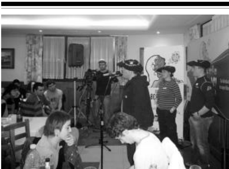
Ttottonoldegi taldekoak, txapela jantzita, bukaerako bertsoa egitean. ZUZENE AMASORRAIN