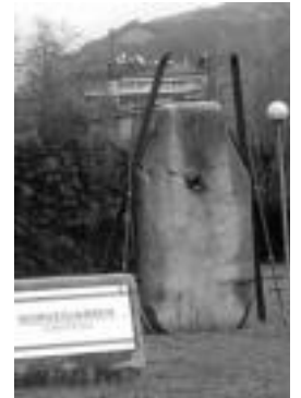
Norvegiarren omenezko oroitarria lurte osoan, Mustad-en lekuan. I.S.

jendetsuetan ere eskualdeko eskiazaile ugari izan da urte hauetan: Kataluniako Beret, Suediako Vasaloppet, Itaiako Marcialonga, Suitzako Engadin, Frantziako Transjurassienne... Norvegiarren eski izpiritua bizirik dirau Tolosan eta bere inguruan.