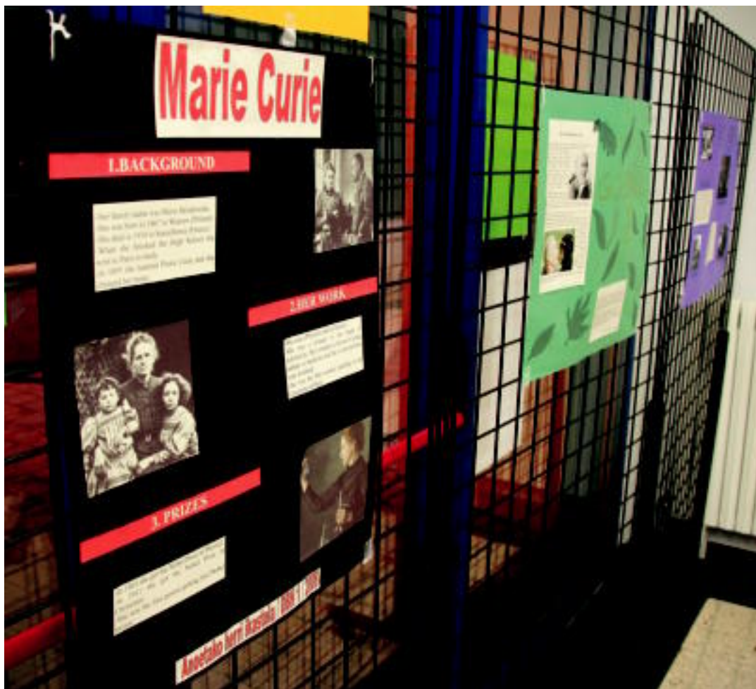
Emakume nabarmenei buruz egindako erakusketa dago ikusgai Anoetako kiroldegian. LHko eta DBHko ikasleek egin dute. IMANOL GARCIA