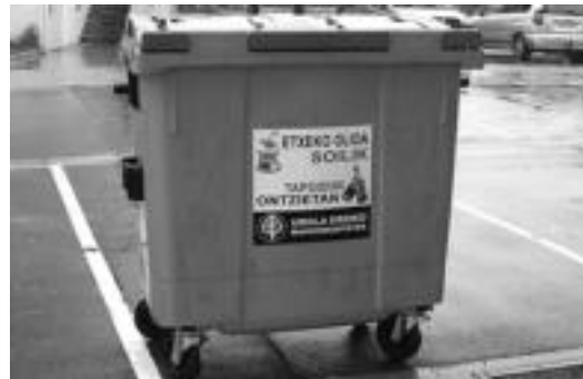
Ettxeko olio tapoidun ontzietan bota behar da, irudian ikusten den bezala. A.I.

Azken puntuan, Organizazio Politikoen lege kanporatzeari buruzko mozioa bozkatu zuten bi alderdiek, baietzkoa emanaz. Ondoren ANV-EAren mozioa irakurri zuten EAren zerrendakide batek eta hau ere bozka zezaten eskatu zien Udal taldeei. Kasu honetan, EA eta EAJren 8 zinegotziak abstentzioa bozkatu zuten.