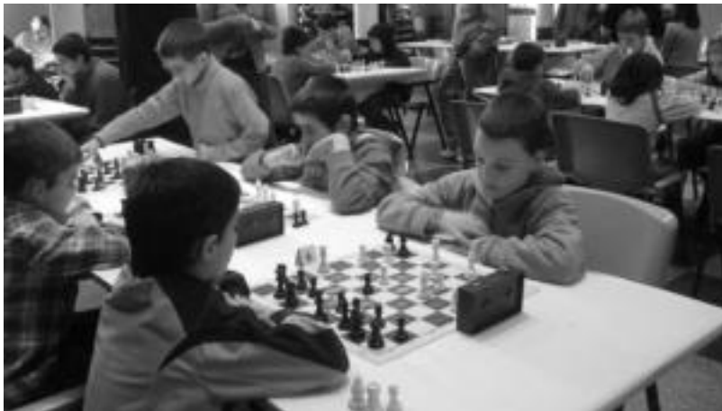
Tolosako Kultur Etxean jokatu zituzten larunbat goizean Tolosaldeko Eskolarteko txapelketaren finalak. HITZA