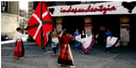
Goitik behera, ikaztegiatiko, Orendaingo, Villabonako eta Alegiko Independentzia eguneko ekitaldiak.

Tolosaldea » Asteburu honetan eskualdeko hainbat herritan Independentzia Eguna ospatu dute.