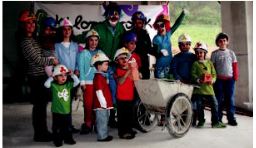
Eskerrik asko emanaldiaren aurkezpena Ikastolaren eraikin berria egin zuten. I. GARCIA

Halazioen Joxe Mendizabal Kilometroak 2008ko koordinatzaileak: «Egiten arigaren ekintza guztiak eraikina eraikitzeko dira. Hemen bertan egin dugu aurkezpena, erakusteko eraikin berria ba-dola aurrera. Hau da gure ametsa». Ikastolatik maiatzaren 6rako espero dute obrak amaitzea.