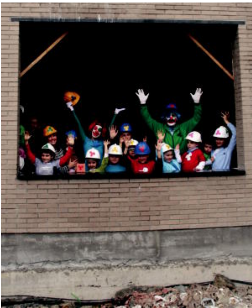
Emanaldiaren aurkezpena obretan dagoen Irurako Ikastolaren eraikinean egin zuten atzo. IMANOL GARCIA