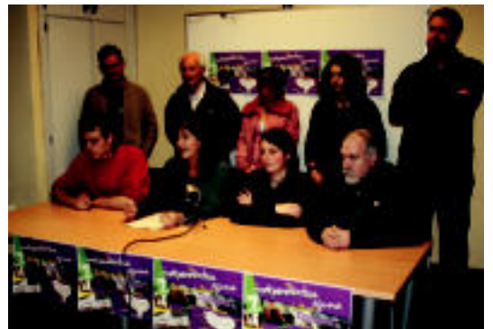
Atzo egin zuten Tolosan Independentzia Egunaren aurkezpena. N. URBIZU