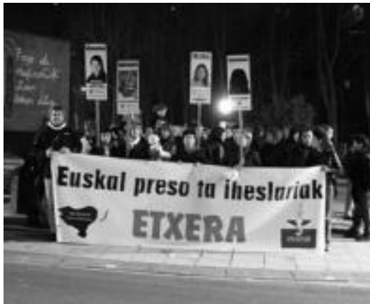
Hilabetero bezala, ohiko tokietan egingo dituzte elkarretaratzeak. A. IMAZ

Etxeretek agertutakoaren araberak, «kartzela aldeketa hauek batik batik Espainian gauzatu dira». Norako aldeketa horien harira, honakoa nabarmendu dute, «ez dutela euskal preso bakar bat ere Euskal Herriratu. Aldiz, bi preso Euskal Herrian kokatutako kartzelatik atera eta urrundu egin dituzte». Honez gain, nabarmendu