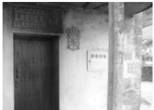
Atearen zati bat erre zen arren, inork ez zuen kalte pertsonalik sufritu. N. GARZIA

Senitartekoez azaldu dutenez, «ekintza honek ez du politikarekin inolako zerikusirik».