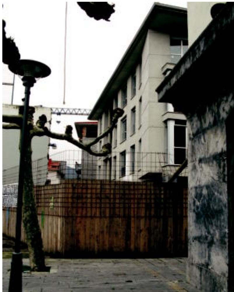
Aburuza eraikuntzak enpresak Villabonan eraikitzen ari da etxebizitza bloke berri bat. I.T.

ten da. «Ez dago prototipo edo eredu mota bat, bikoteak, banaka, heldu zein gazte hurbiltzen dira guregana». Hori bai, oro har, bezeroa «exijentea» da, eta «etxebizitzaren prezioari» begiratzen dio batik bat. «Askotan etxebizitza euren erara moldatzea nahi izaten du bezeroak baina hori ezinezkoa da», dio. Hala, haiek proiektua egiten dute eta bere horretan onartu behar du