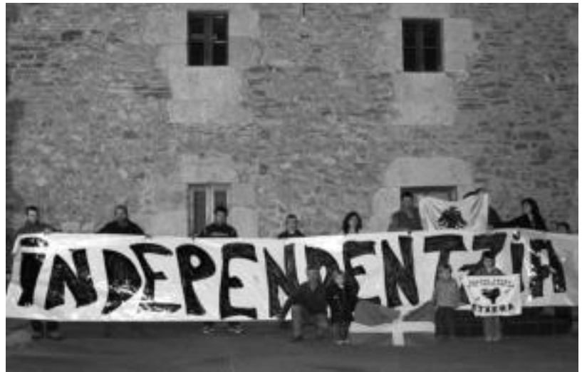
Gaztelun Independentzia eguna joan den larunbatean ospatu zuten. Bukarera afaria egin zuten. HITZA

Ibilaldia, honako izango da: Triangulo, Plaza Zarra, Berdura Plaza, Gorriti Plaza, Plaza Berria,