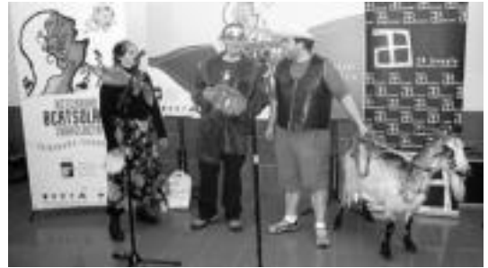
Ttottondegia taldeak Amasan egindako agurraren une bat.