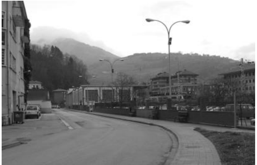
Voith-Gorostidi eremuko proiektuaren ostean, San Esteban auzoan egingo dutena litzateke datozen urteetan aurreikusten den handiena. I.T.