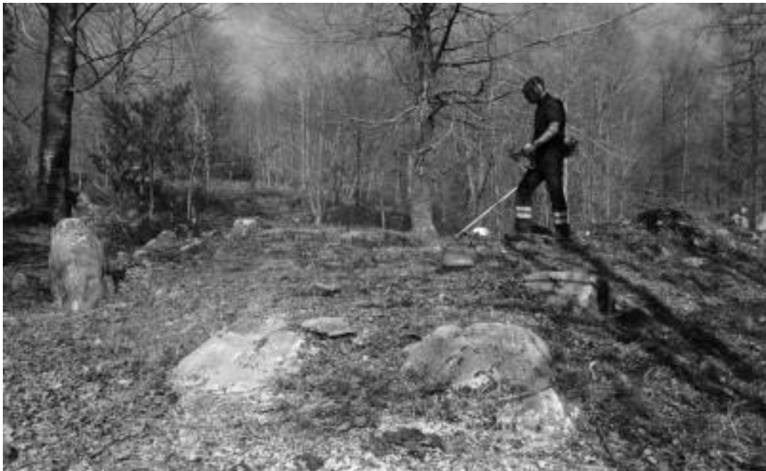
Harriak garbitu ondoren, harrezpila kanpotik piketez babestu dute.