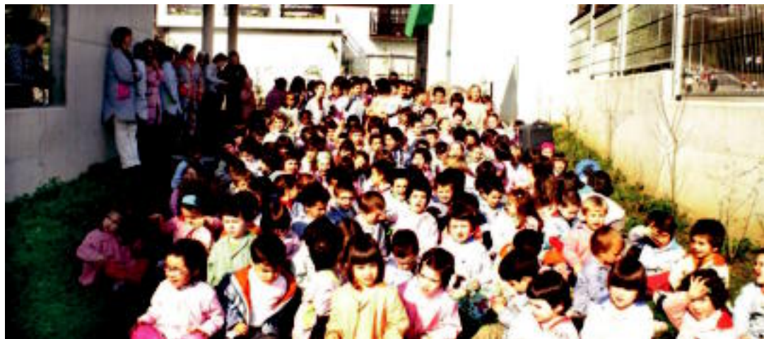
Haur Hezkuntzako ikasle guztiak bildu ziren eraikin ekologiko berriaren aurrean, Bandera Berdea atzean dutela. HITZA

HITZAK ez du bere gain hartzen egunkariaren adierazitako esaneren eta iritzien erantzunik.