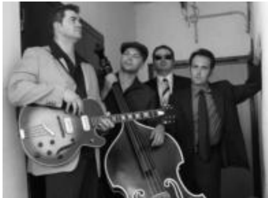
The Reverendos taldeak Atxulondo tabernan joko du, 23:00etan. HITZA

Special 20 taldeak bost musikari biltzen ditu. Blues musika egiteaz gain, afroamerikar, jazz, r&b, soul,