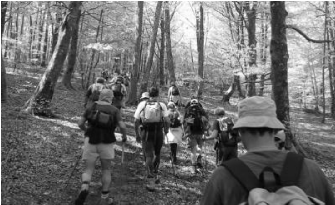
Maiatzaren 18an egingo den ibilaldian 68 kilometro zeharkatu beharko dituzte mendizaleek hamalau ordutako tartean. JOXEMI SAIZAR

Maiatzaren 18an ospatuko da, 14. aldiz, Aralarko Adiskideek antolatutako ibilaldi neurtua; martxoaren 25ean irekiko da internet bidezko izen-ematea, eta apirilaren 7an, arrunta.