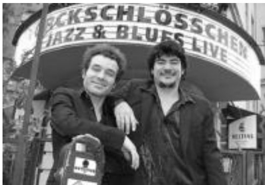
Egarrri tabernan, 00:15ean, Los Reyes del K.O. ariko dira. HITZA