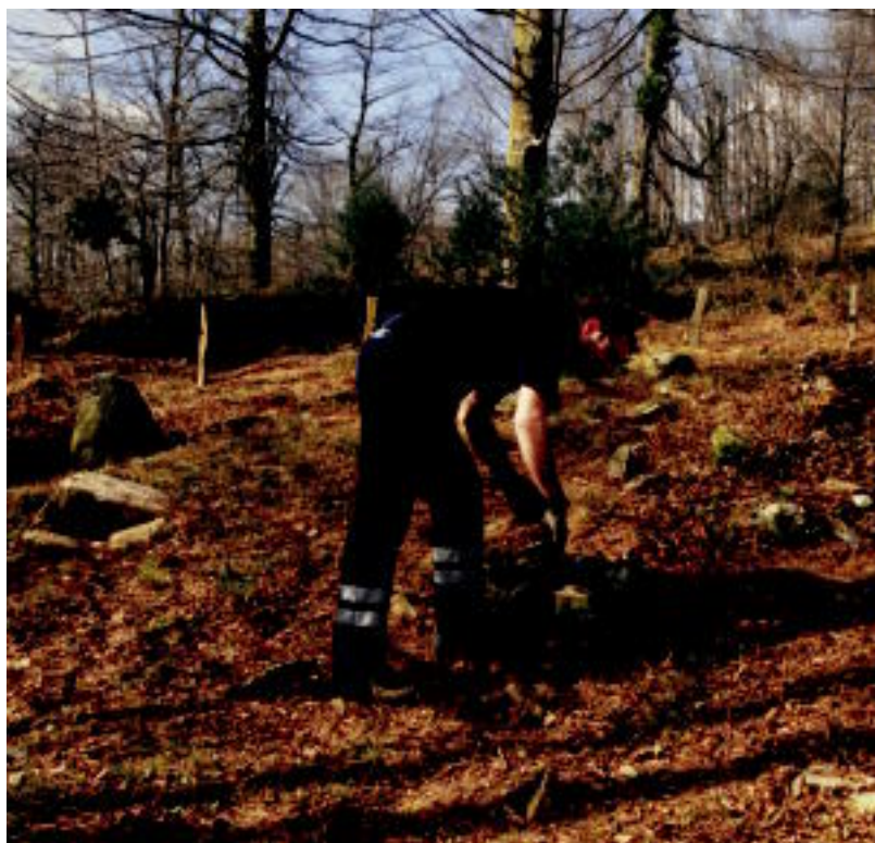
Sasain Bizkargo cromlecha garbitzen, atzo goizean; helburua «kalte gehiago ez jasotzea» izango da. MIEL MARI ELOSEGI