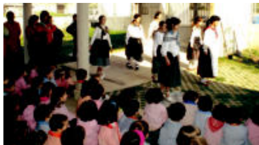
Ekitaldiaren baitan, euskal dantzak dantzatu zituzten.

Amaitzeko, bertso batzuk abestu zituzten. Hauetan, «ingurumena zaintzen duen eraikin moderno» bezala deskribatzen zuten ikastetxea.