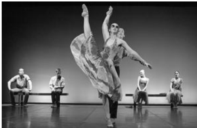
Biarritz Baleteko junior taldea emanaldietako batean.

Hiru pieza koreografiko eskainiko dituzte Leidor aretoko eszenatokian. Hala, dantzarien bertutez gozatzeko parada izango da