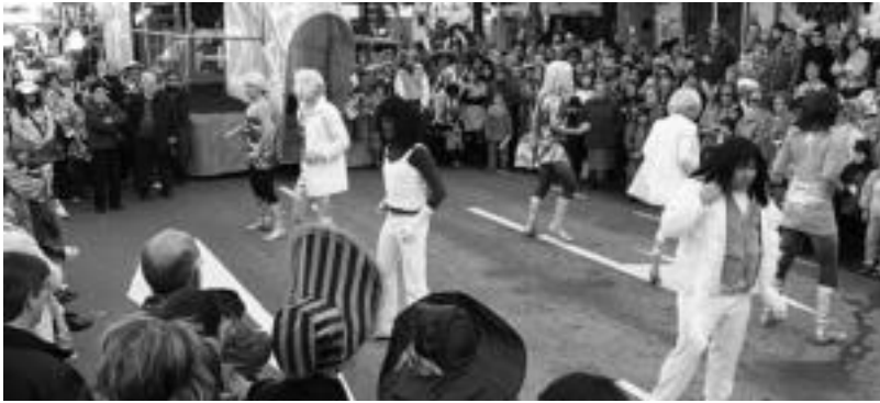
Orotara, karroza eta konpartsak kontatuz gero, 200 inguru atera ziren kaleetara. INIGO TERRADILLOS