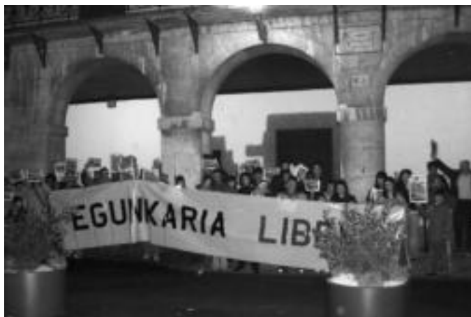
40 lagun inguru bildu ziren Berastegiko plazan atzo egindako elkarretaratzean. HITZA