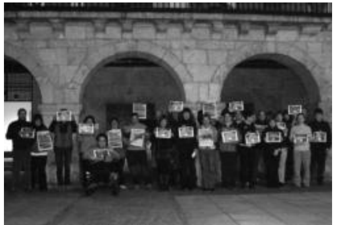
30 lagun inguru bildu ziren atzo iluntzean Amezketan egindako elkarretaratzean. HITZA