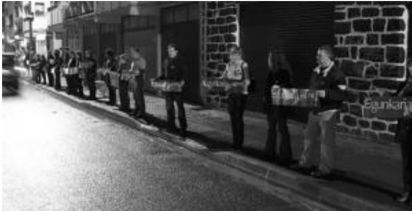
Villabonan atzo iluntzean egindako elkarretaratzean 40 lagun inguru bildu ziren. IMANOL GARCIA