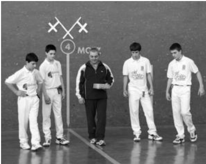
Joan den urtean Nafar Jokoen barruan Leitzan jokotako partidetak bat, Leitzako eta Burlatako bikoteen artean.