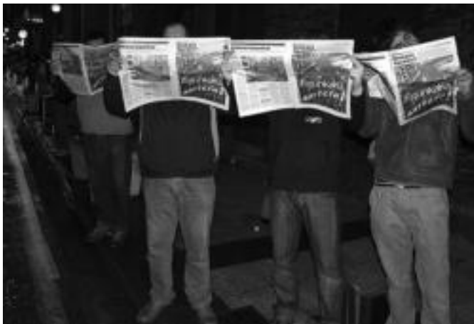
60 lagun inguru bildu ziren Ibarra egindako elkarretaratzean. ASIER IMAZ