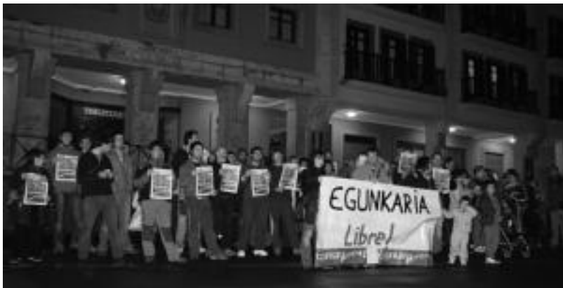
80 lagun inguru bildu ziren atzo Anoetako plazan, eta ondoren Irurara joan ziren oinez. ESTI EZBIZA

Del Olmo epaileak Euskaldunon Egunkariak ETA-rekin lotura izatea leporatu zuen. Hau da, honek adierazitakoaren arabera, « Egunkaria ETAK finantzatu zuen, eta ondorioz, zuzendariak eta arduradunak ere ETAK izendatu zituen». Inputatuetako batzuk, sumario nagusian daude sartuta, eta beste batzuk, auzi ekonomikoan. Azkenik, badaude bietan dauden batzuk ere. Hala, kartzelara joateko arriskuan daude oraindik ere auzi-petutak.