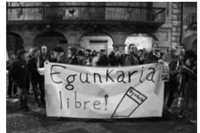
50 lagun inguru bildu ziren Alegian egindako elkarretaratzean. PATXI RENOBALES