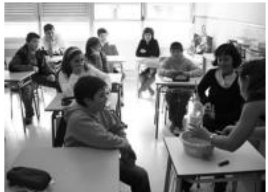
Hitzaldi-tailerrean esperimenduak ere egin dituzte, zigarro batek pertsona batean eragiten dituen kalteak ikusteko. I. GARCIA

Tabakoaren Legea aldatu denetik, baina, Nebredak dioenez, «na-