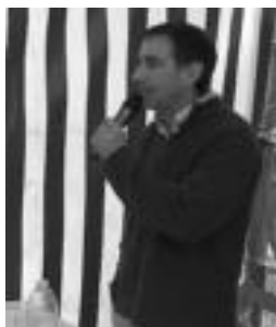
Peñagarikano bertsoan. HITZA

Albiztur » Sarrerak salgai daude herriko tabernetan eta udaletxean; bihar izango da hauek erosteko azken eguna.