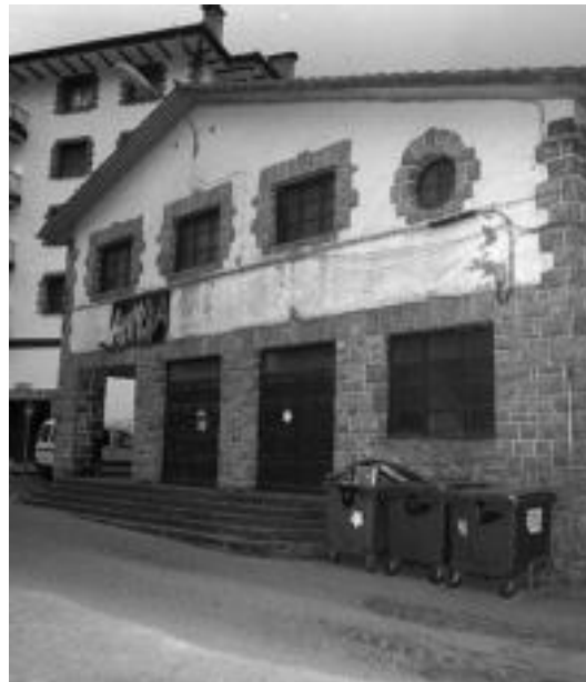
Zinean egingen dute sari-banaketa, 13:00etan. N. GARZIA

II. Mikro-Ipuin Lehiaketaren epaimahaia 4 adituk osatu dute: Alberto Barandianen idazle eta ka-