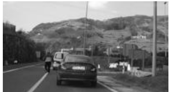
Puntu honetan gertatu izan dira istripuak.

Amaroztik Leaburura doan errepidean edo Alegiatik Tolosara dagoen N-1aren bigarren sarreran auto istripu ugari gertatu dira. Lau kasu ezberdin ezagutu ditut eta denak puntu berean, bertan dagoen STOpean. Bertan ez da alde baten errepideirik kusten, Leabururitik beherantz datozten autoak ez dira ikusten, itxurakerirako bakanrik dagoen beldardiaren erruz. Zenbat istripu gehiago gertatu behar dira bertan, bidegurutze hori