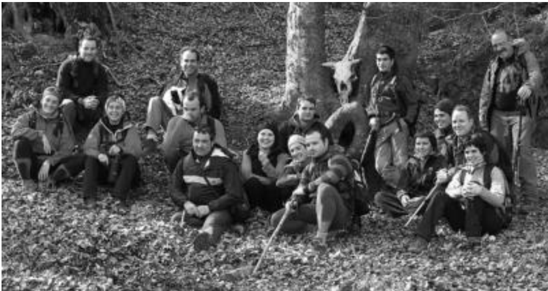
Orbel gainean eserita argazkiaren zain. Ez da erraza argazki batean horrenbeste jende irrifarez ateratzea, baina mendi irteerak... HITZA

Bai Euskal Herriari eta Haitzetan Raju Taldeak, 'Euskal Herria ezagutzuz, Lurraldetasuna sustatuz' egitarauaren baitan Bizkaia mendira irteera egin zuten herenegun, 18 lagun eta Txo bildu zirelarik.