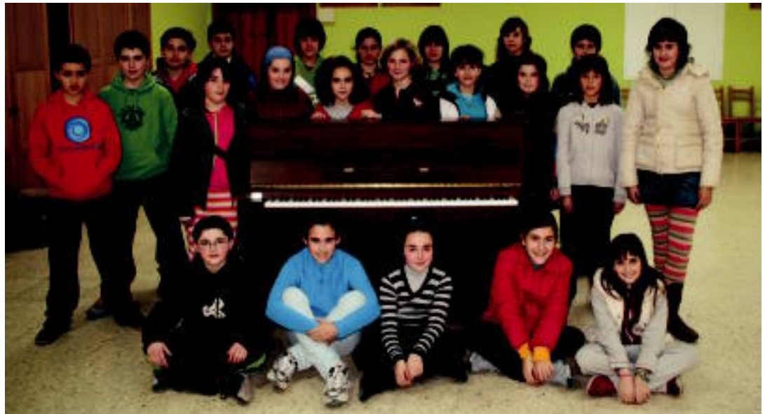
Andoaingo Piano Jaialdian parte hartuko duten Loatzoko musika eskolako hainbat ikasle Villabonako Kultur Etxean.

HITZAK ez du bere gain hartzen egunkariaren adierazitako esaneri eta iritzien erantzunkizunik.