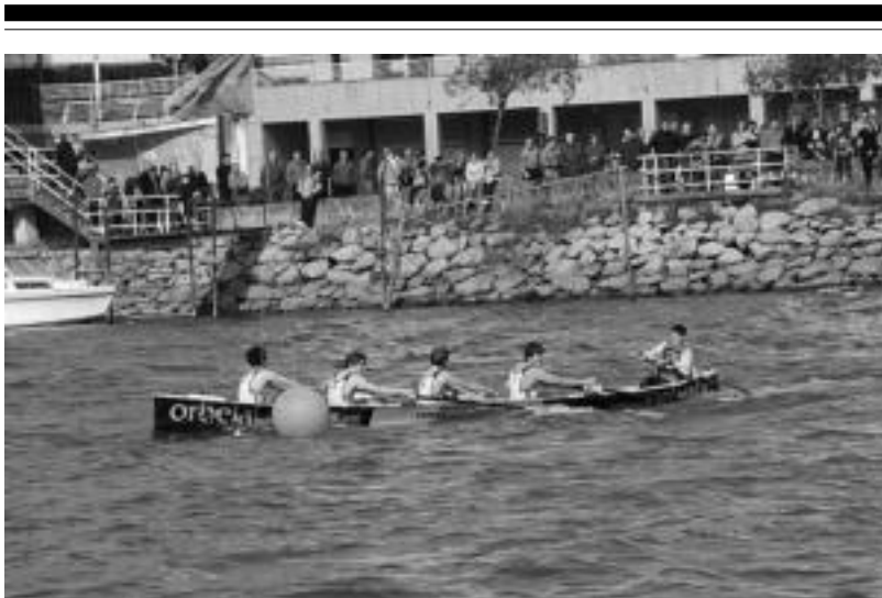
Tolosaldeko Arraun Klubeko kadete mailako mutilak, igandeko jardunaldian, Orioko uretan.