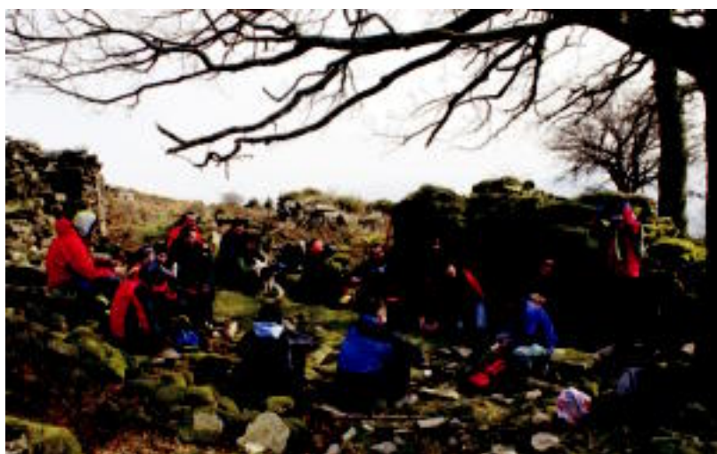
Haizeari aurre egin zioten mendizaleek; behean, esfortzua ostean, indarrak berreskuratzen. HITZA

ARRAUNA Gipuzkoako Batel Ligaxkan bigarren jardunaldia jokatu du Tolosaldeko klubak 3