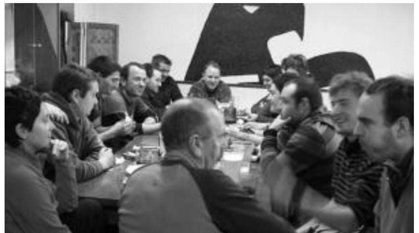
Ibartarrak Balmasedako Herriko Tabernan, egun pasaren amaieran indarrak berritze aldera. HITZA

Ordubate inguru konpainia ederrean lasai egon ondoren, etxerako unean, sukaldari lanetan zebilen gazteak etxe itxurako erailak zirela zurririk denak erakustez gain, argibideak eskaini ditu 18 ibartar ezagutu berrientzat, aspaldi ikusi gabeko lagun zaharrei bezala. «Euskara argitasunez hitz egiten denean, sortzen duena izugarria izan daiteke. Bestalde, iluntasunez edo artifizialki erabiltzen duena lotsagarri uzteko gaitasuna du hizkuntza berak».