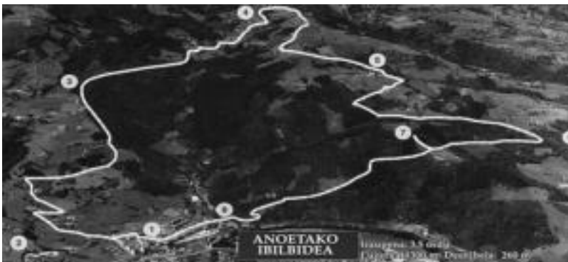
Triptikoaren azalean udalerritik egin daitekeen mendi ibilaldiaren mapa argertzen da. HITZA