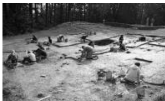
Aurtengo dantza sokaren une bat eta Basagainen indusketak egiten. HITZA

Donejakue bidea, Burdin Aroko Basagain herrixka, jai eta ospakizunek ere bere tartea dute: dantza soka, San Joan bezperako afaria eta koroaren emanaldia eta herriko festak.