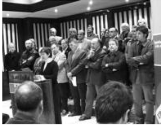
Egoeraren «larritasuna» agerian jarri zuen atzo euskalgintzak Bilbon, eta gizarteari berriro euskarazko kazeta «defenditzeko» dei egin zion. L.M.

Bi helburu izango ditu gaurko bilerak. Hilaren 20an beteko dira 5 urte Egunkaria itxeko agindua eman zutenetik, eta prozesu juridiala amaitzean den honetan, epaiketaren aurreko kanpaina prestatzea izango du helburuetako bat sortuko den batzordeak. Dagoneko Euskal Herriko hainbat zonaldean sortu dituzte edota