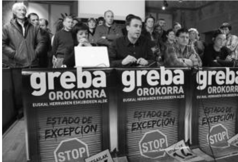
Tolosako ezker abertzaleko kideak atzo udaletxean emandako prentsa agerraldian. ASIER IMAZ

Lehenik, «Estatu espainolak, PSOE alderdiaren eskutik, Euskal Herriaren aurkako eraso bortitza-ri ekin» diola esan zuten. «Eraso bortitzaren» adibide gisa, «egun prentsa agerraldi bat eskaintzea, galdeketa bati erantzutea edota hizaldi bat ematea, bortizki atxilo-