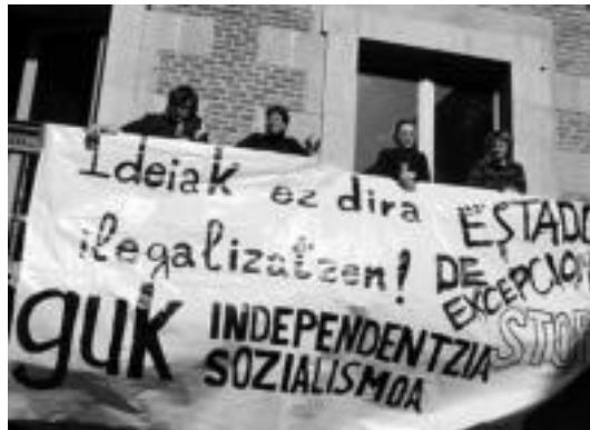
Ezker abertzaleko kideak udaletxean egiten ari diren itxialdian.

Itxialdiaren zergatiaren inguruan, egungo egoera salatu nahi izan dute, nahiz eta erabakian udaletxean sartutako mozioak ere bere