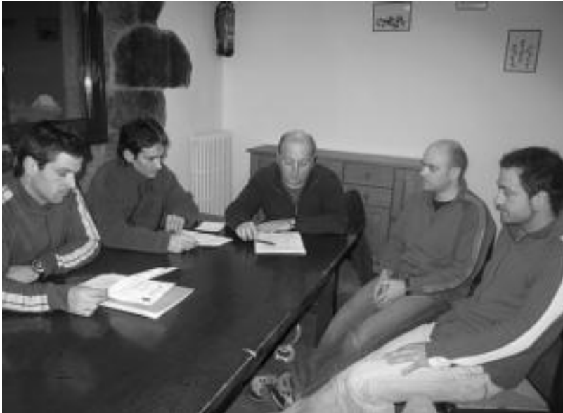
Mendibil Mendi Taldeko zenbait kide joan den ostiralean Aurreran egindako batzarrean. N. GARZIA