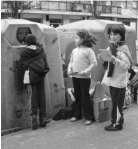
Fleming ikastetxeko ikasleak zaborrari buruzko lana egiten. HITZA

http://www.tolosaldeko hitza.info/blogak/fleming