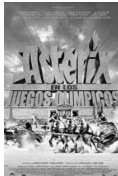
'Asterix en los Juegos Olimpicos' eta 'Fracture' filmak izango dira ikusgai asteburu honetan Leidor aretoan. HITZA