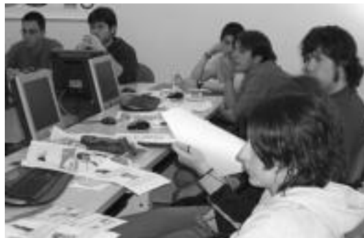
Ikaslanen baitan dago Tolosaldea Lanbide Heziketa Institutua. HITZA

Hezkuntza » Gaur arratsaldien Eroski merkatal gunean egongo dira sare publikoaren eskaintzen berri emateko.