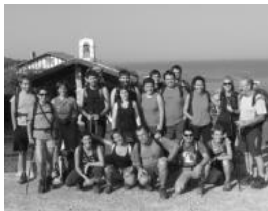
'Euskal Herria ezagutzuz, lurraldetasuna sustatuz!' Hendaian. HITZA