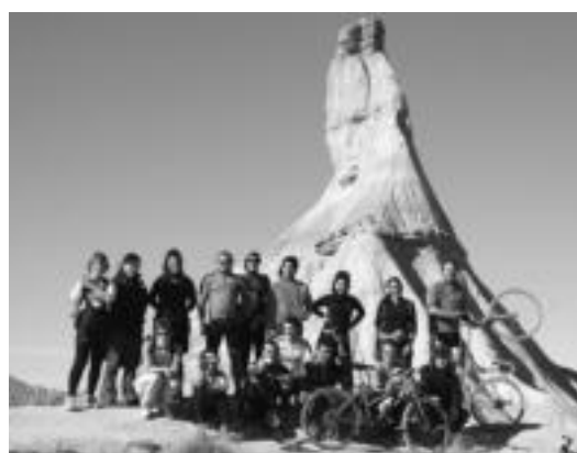
Orain artean egindako azken irteera; bizikletaz bardeetan barrena. HITZA