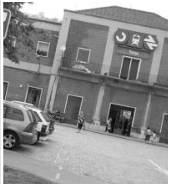
Erabiltzaile kopurua asko igo da aurtengo Inauterietan. I. ETXEBESTE

Usabalgo futbol zelaian Futbol zelaian 3 futbol partida ikusteko aukera izango da bihar: goizean, 09:30ean, kadete mailakoen artekoa izango da, Tolosa Cf eta Texasen artean. 11:00etan, gazteen ohorezko mailakoa izango da, Tolosa CFren eta Beti Gazteren artean. Eta 18:00etan, emakumezkoen ligako partida izango da, Tolosa Cf eta Intxaurdi taldeen artean, hain zuzen ere.