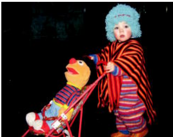
Azken eguna izanagatik Tolosako kaleak kolorez jantzi ziren, banakako zein taldekako mozorroekin. E. EZEIZA/N. URBIZU/ N. LATABURU/ I. TERRADILLOS