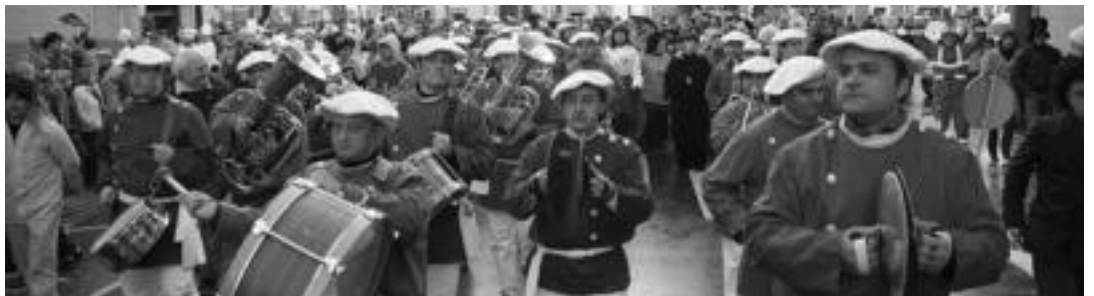
Aiz Orratz txarangarekin Zezen Plazatik kanpora atzean jendea dutela. Datorren urtera arte pattar zezenik ez. I. GARCIA