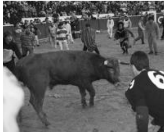
Jende asko bildu zen atzoko Pattar Zezanean. I.G.