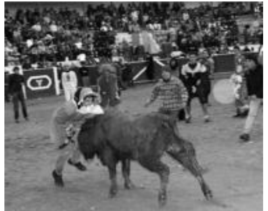
Edozein mozorrorekin ausartzen dira zezen plazara ateratzen direnak. I.G.