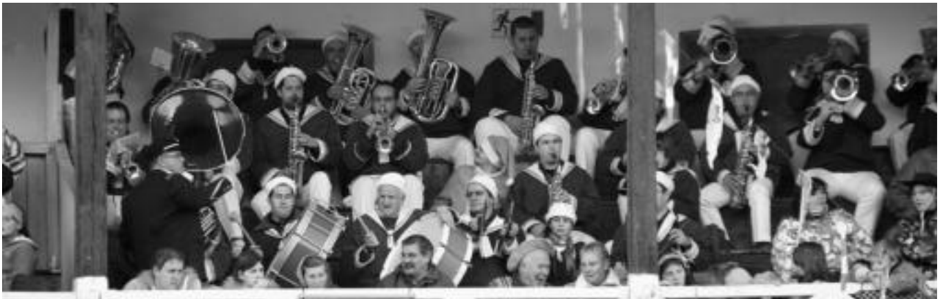
Aiz Orratz txaranga, Zezen Plazan jendea eta giroa alaitzen. Hauek ere ez zuten galdu plazan gertatzen zena. I. GARCIA