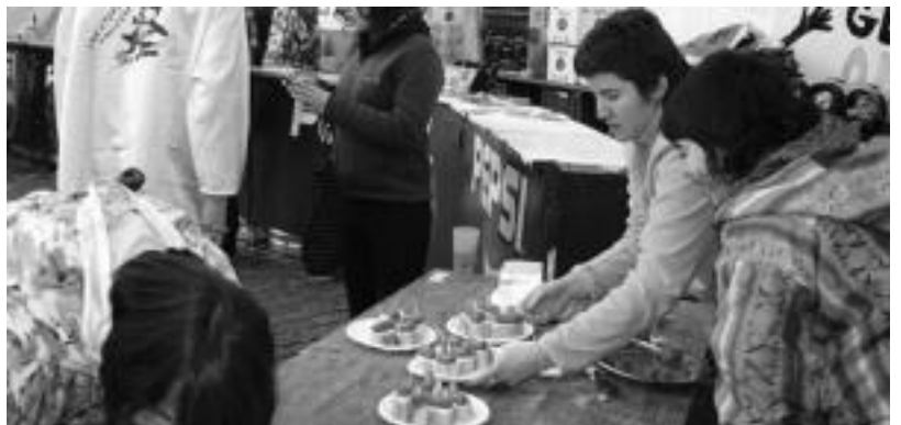
Kalean, tabernetan, ikastola edo ikastetxeetan txistorra nagusi atzokoan. A.IMAZ