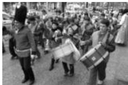
Tolosako Hirukide eskolakoak San Frantziskotik kalejiran. HITZA