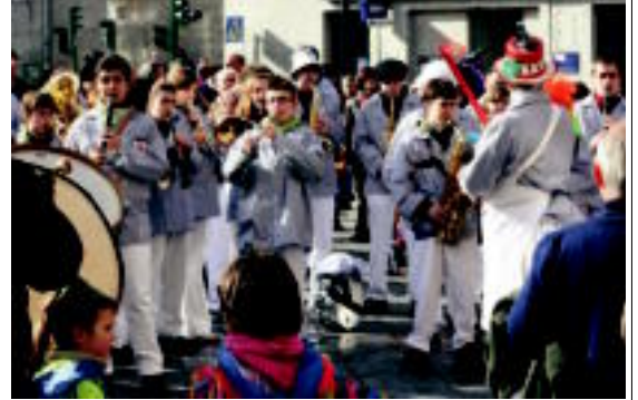
Ostegan Gizenekin batera Galtzundik ere agerraldi egin du, eta ikusgai izango da Inauterietako egunetan Triangulo plazan. | URZUA