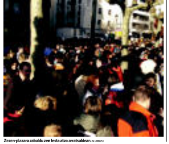
Zezen-plazara zabaldu zen festa atzo arratsaldean. | URZUA

Erremontarri Kalea, 2/G • TOLOSA Tel. 945 67 16 30