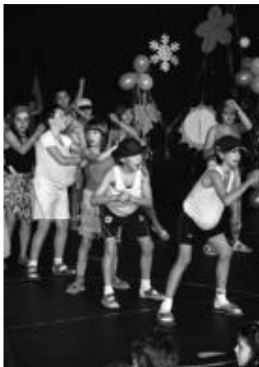
Ikuskizun handia prestatu zuten Abraham Olano kiroldegian Anoetako eta Irurako ikastoleetakoek. HITZA