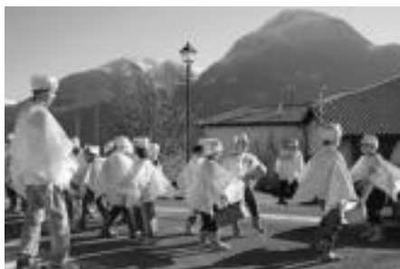
Abaltzisketan Aralar elurtuaren ikusten zela ospatu zuten. HITZA