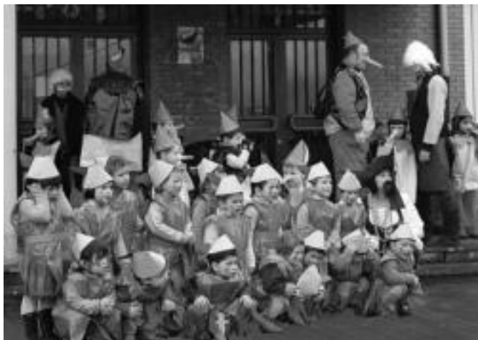
Ibarroko Uzturpe Ikastolakoak mozorrotuta ikastetxearen aurrean. HITZA