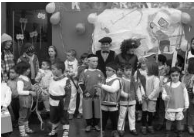
Tolosako Laskorain Ikastolan, adinen ezberdinetako haurrak mozorrotuta. HITZA