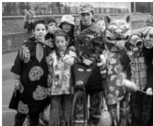
Tolosako Samaniegon mozorro ugari ikusi ahal izan ziren. HITZA