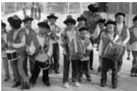
Berrobiko ikasleak txarangaz jantzita. HITZA