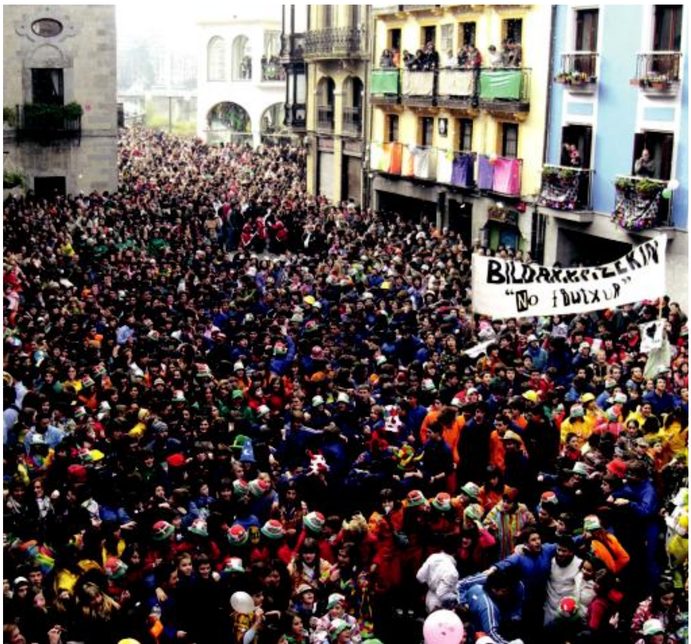
Jendetzak eman zien eguerdiko 12:00etan ongiatorria, Plaza Zaharrean Tolosako Inauteriei. N.URBIZU

OSTIRAL MEHEA Txistularien kalejira, xexen festa eta Arpegi taldearen ikuskizuna izango dira, besteak beste 2-7