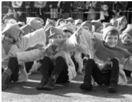
Villabonako plazan eman zuten ikuskizuna ikastetxeetako ikasleek. HITZA

Gaurkoan ere hainbat eskolen txanda izango da. Hala, Adunan (15:00), Alkizan (14:30), Ameztan (15:15), Asteasun (15:15) eta Zizurkilan (15:30) izango dira.