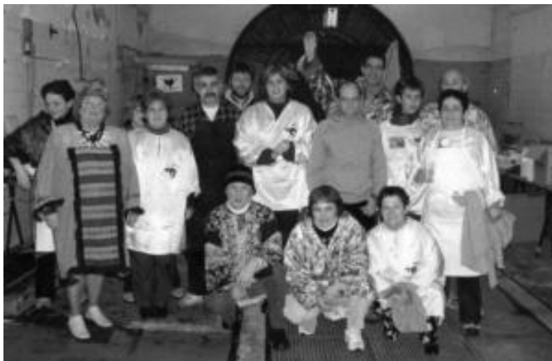
Boluntarioen artean egiten dituzte sukaldatze eta zerbitzari lanak; irudian, antolatzaileetako batuk, Abastosen.

Txapelketako sail bakoitzean lan ezberdina egin beharko dute bertsolariek. Kanporaketetan honako hau egin beharko dute: Zortziko handian binaka gaia emanda hiruna bertso osatu arte; zortziko txikian binaka ofizioka hiruna bertso osatu arte; zortziko txikian bi puntu irerantzun eta gaia emanda, bakarka bi bertso.