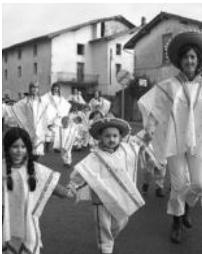
Bidegoianen mexikarrez jantzita kalejiran ari ziren eskolakoak herritik zehar.