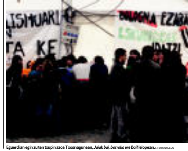
Egunerdi egin zuten txupinazoen Txosnaganean, Adak bot, borroko ere bai! lelopean. | TOLOSA 2020