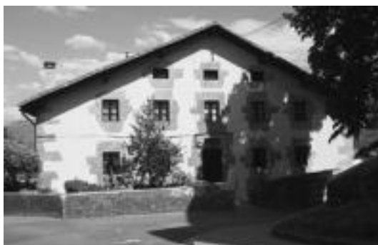
Eskolak Larraularen duen egoitzan eskainiko dute ikastaroa. HITZA

Hezkide Eskolak haur eta gazteen astialdirako begirale ikastaroa antolatu du Tolosaldean. Eskolak Larraularen duen baserrian garatuko dituzte. Ikastaroa 200 ordukoa da eta otsaila eta maiatza bitartean honen lehenengo zatia eskainiko