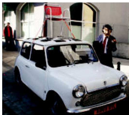
'Mr. Bean'-etik hasi eta ilargirainoko bidaiaren prestaketa ikusteko aukera izan zen Inauterietan. Erdian, Lizartza eta Leitzako lhoteeetako partaide txiki eta helduak. ASIER IMAZ