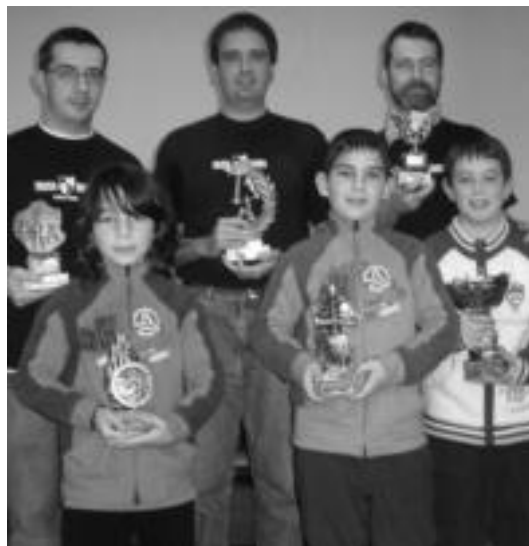
Tolosako Xake Txapelketako irabazleak ikasleekin batera. HITZA

ikasle ere etorri zen, txapelketa Tolosaldeko Eskolarteko Jokoetarako prestaketa gisa aprobetxatu asmoz, eskolarteko txapelketa hamabost minutuko partidetak jokatu zuten baita, baita ere. Hain zuzen