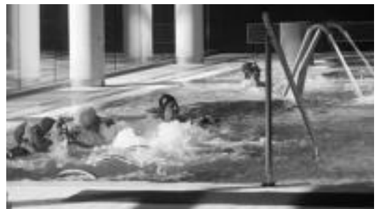
Kiroldegiko arazoak eta kexak aztertuko dituzte, eta konponbidea eman. HITZA

Ostiraleko partida Futbol jokalariek beterrak hartzen dute parte bertan. Ostiraleko partida Futbol jokalariek beterrak hartzen dute parte bertan. Ostiraleko partida Futbol jokalariek beterrak hartzen dute parte bertan.