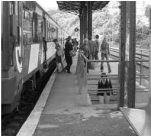
Tren zerbitzua berezia izango da Inauterietan, autobusena bezala. J. SAIZAR

Bestalde, Kondeaneko aldatik Ibarra-Leitzara jotzeko bidea erabiltzea egongo da, garraio pu-