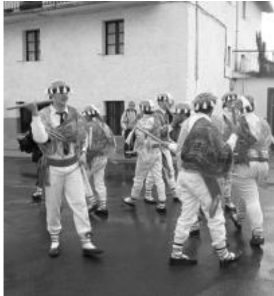
Amezketako Talaiak izako saio batean. Eskuinean, Abaltzisketako Txantxoak. Jantzera oso diferentea dute, baina dantza oso antzekoa da. N. URBIZU