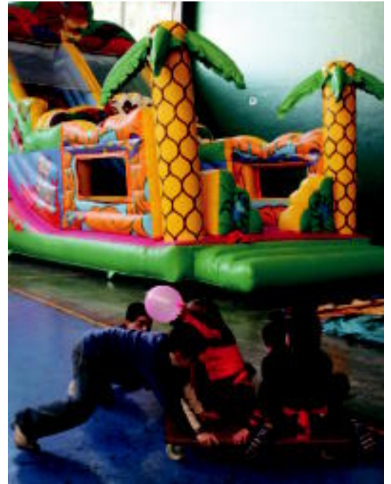
Leitzako haurrak imaginazioa landu zuten puzgarrien zain zeudela. ASIER IMAZ