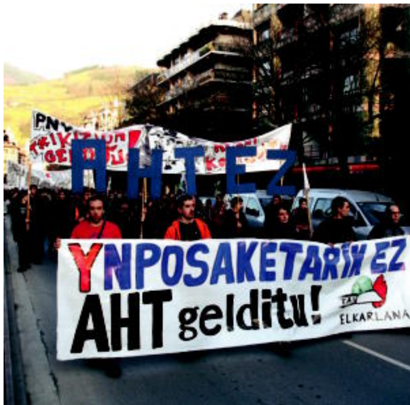
Manifestazio jendetsua izan zen atzokoa, Ynposaketarik ez AHT Gelditu! lelopean. ESTI EZEIZA

SALAKETA «Hainbat komunikabidek eta agintarik aurrera eramaten ari diren intoxikazio kanpaina salatzen dugu» 7