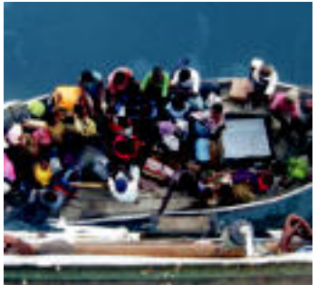
Malawiako lakua zeharkatu duen txalupa. FERNANDEZ