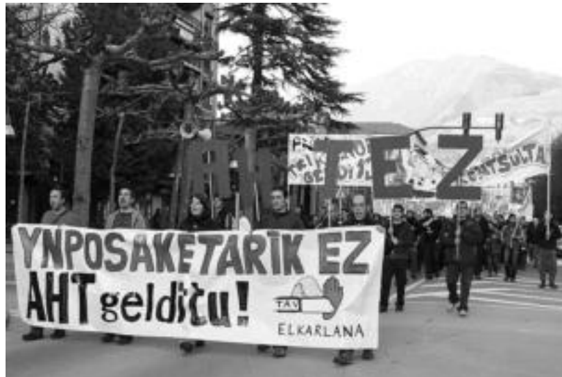
Ehundaka lagun atera ziren Tolosako kaleetara AHTari ezetz esateko; irudian errealea. E. EZEIZA

Mobilizazio honekin bat egin zuten, Tolosaldeko EAE-ANV, Tolosako Ezker Batua, Tolosaldeko ezker abertzaleak, Tolosako Aralar, LAB, EHNE, Bilgune Feminista, Euskal Herria Sozialista, Tolosaldeko Gazte Asanbladak, Tolosako Arraun Kluba, Ikasle Abertzaleak, Segi, Alpino, Oargi, Haitzetan Raju, San Esteban auzo-elkarteak, Amaroako antzerki artisaia, Eneko Haritzaren lagunak, Amaroak auzo elkarteko zuzenda-