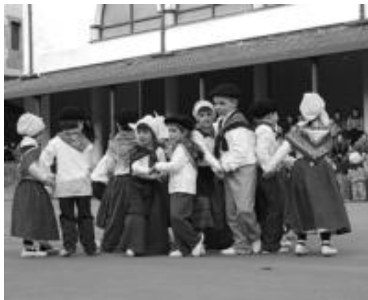
Berastegiko plaza alaitu zuten dantzari txikiak. Ondoren poteoa egingo zuten. Leitzaan puskabiltzan ibiltzen dira. Irudian Maritxuren etxean. Urtero atsegin handiz hartzen dituzte. N. URBIZU