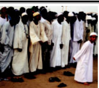
Ezerkerio argazkian, derbitsean zereemonia erlijiosa Etiopian, borobill batean jendea kantari, dantzari eta musikariekiekin eskulanean Ekiakde Hurbiletik Hegoa/ikaraino egindako bilduma. FERNANDEZ