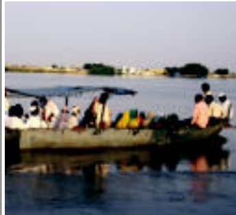
Txalupa bat jendea betetzen Nilo ibiluan, Sudango partean. FERNANDEZ