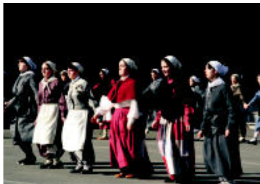
Ikusleen artean gizon bat atera zuten; behean, neskek dantzan. E. EZEIZA