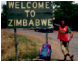
Bidaia tolosarra Zimbabwoko megal. FERNANDEZ

Gehien hartu zaituztena? Nolako kantarik. Victoriakoak ez nintzen ondo ikusi ez zelako euri garria. Eta gero nire bizitza izusi dudako guzuztik harri gertuena derbitsean fustizian da, jendea transezian ikusta, buelak, korrika eta jauzia. Edo bestela antzerkia ando egiten zuten. Turkiako zuzentzen nuen, baina desberdina zuten. Esperientzia bereziena bat? Lihano Hezokako jendearen elgoketa eta bere ideologia eta helburua ezagutzeko aukera izan zuten.