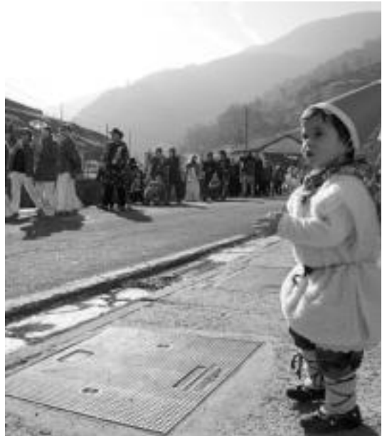
Lizartzako Inauterietan kalejira egin dute eguerdian.

Ondoren, txokolate beroa izan zen Guraso Elkartearen eskutik. Poteoaren ondoren, berriz, afari bikaina izan zen.