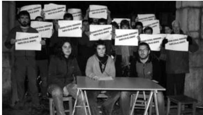
Txosna Batzordeko kideak Euskal Herria Plazan, herenegun emandako prentsaurrekoan.

Dena den, Tolosako Udalak «beste aukerarik ezean», onartu behar izan duela Txosnagunea Euskal Herria plazan kokatzearen eskaera salatu dute, eta aurtengoa ere ez dela nahikoa esan dute. «Behingoz, herri guztietan bezala, Tolosako txosnek gune finko bat izatea aldarrikatzen dugu. Gune erreferentea izan dadin herritarrentzat, eta gu, toki horretara egokitu gaituzten eta urtetik urtera gune egokiago bat sor dezagun. Horretarako, Euskal Herria plaza