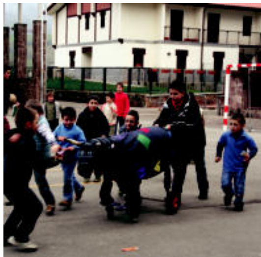
Berastegin zezenaren aurrean jarri ziren ausartenak. ESTI EZEIZA