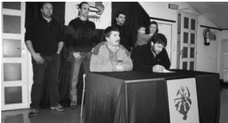
EHNEko ordezkariak, atzo eguniko agerraldian.