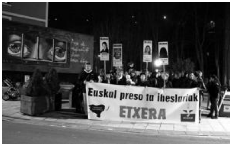
Hilabeteko azken ostirala izaki atzo, elkarretaratzeak egin ziren ohiko herrietan. ASIER IMAZ

Gipuzkoako Federazioak Bengoa-ren jokabidea «moralaren aurka-koa izateaz gain, etikatik kanpo» dagoela esan du, eta bere kirol ne-gozioa «bideratu behar duela».