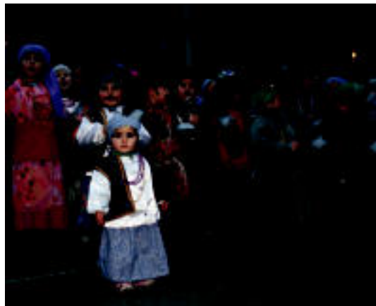
Anoetako eta Irurako haurrak, Anoetan. NEREA URBIZU

Ibarrakogatzetxoak ere ez ziren salbuespena izan eta kalejiran atera ziren herriatik kaldereroen etorrera iragarri eta herriko kaleak alaituz.