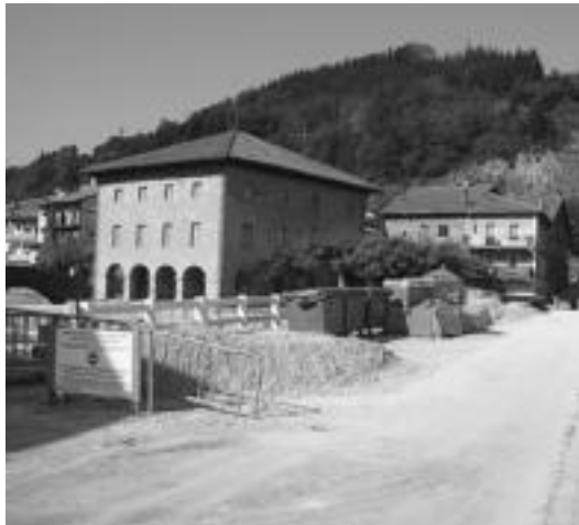
Azken hilabeteetan Alegiko Kultur Etxera joateko zubi inguruan obrak egin dituzte. Beste hainbat aldaketa egin ahal izango dira hainbat txokotan. N.U.

Ohiko bideez gain (udal bulegoak, www.alegia.net web gunea, udal-erretxeko buzoia, eta Batzorde irekietan parte hartzea), otsailaren 16an, Kalez kale ekimena antolatzea erabaki dute. Bertan, hala nahi duten herritarrek plazan bildu eta handik abiatuta herriko kale eta txoko guztiak pasako dituzte bertako be-