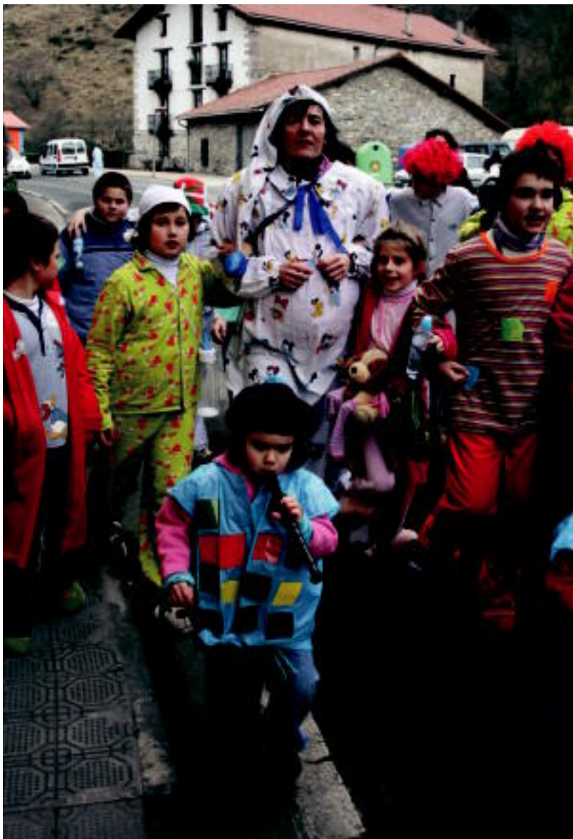
Atzo, Lizartzako Inauterietako une bat. A. IMAZ