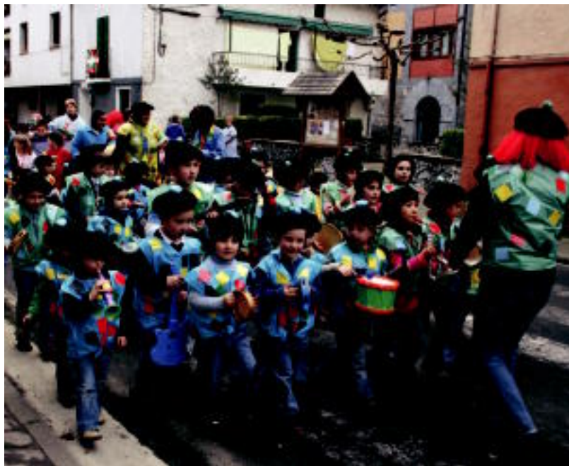
Musika talde ederra osatu zuten Lizartzako eskolako haurrek; herriko kaleetan kalejira osatu zuten. A. IMAZ