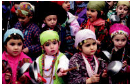
Zizurkilen kalejira egin dute. Lapikoak ederki astindu zituzten. IIMANOL GARCIA