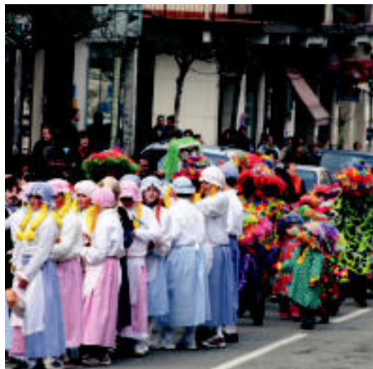
Giro paregabea sortu zuten Leitzako ikasleek herriko kaleetan. E. EZEIZA