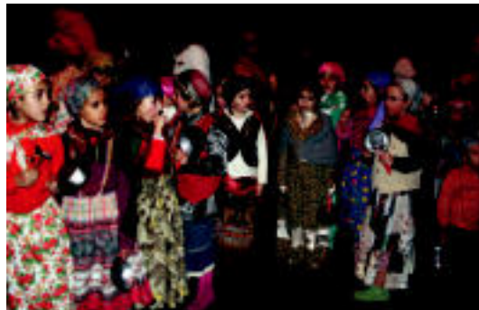
Ibarran dantza egin zuten ere, kalejiran. ASIER IMAZ