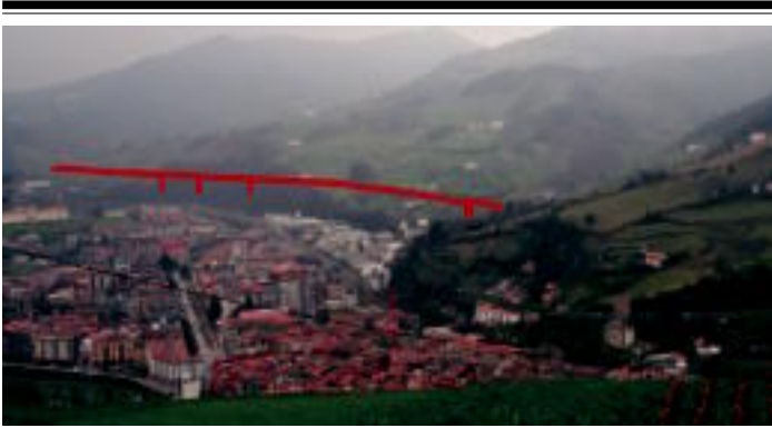
Irudian, Tolosa okupazioa izazkundik. Marragorriak AHTren gurtzi gorabeherako bilibidea adierazten du. (A. ELIZABE)