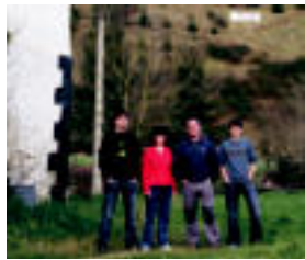
Karteke dagoen tokian hasiko da tunela.

Zer da burun duzuna, zerk kezka izango du?