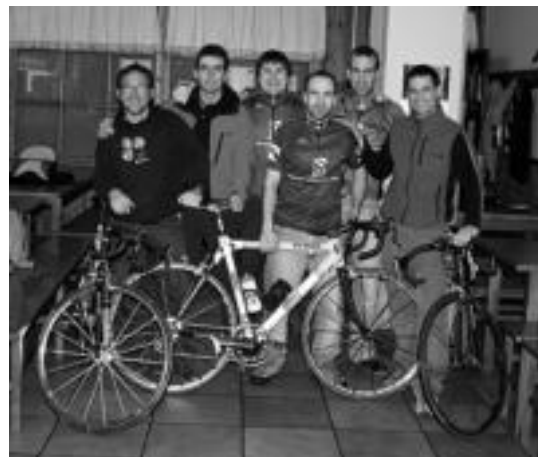
Ibarrako Zikloturista Taldeko kideak atzo prentsaurrekoan. ASIER IMAZ

munduko eragile eta langileak ezin dugu isilik geratu oinarrizko eskubideen zanpaketa aurrean». «Ezin gara isilik geratu», horiek izan ziren bi kazetarien irakurraldian behin eta berriz nabarmendu ziren hitzak. Agiria zerrenda osorik irakurtzeko www.berria.info sartu behar da.