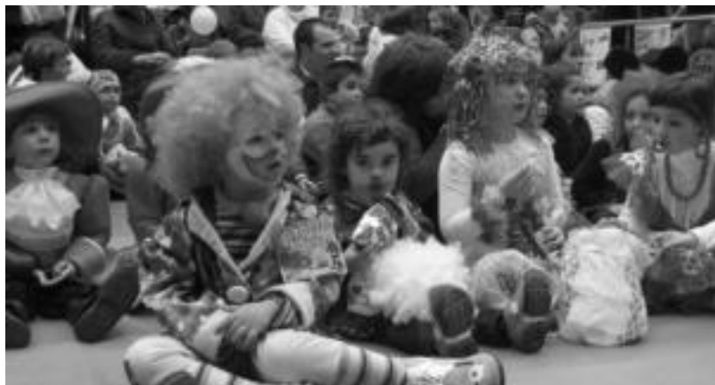
Haurrek ederki igaroko dute larunbat arratsaldean Inauterietako haur jaialdian. I. GARCIA