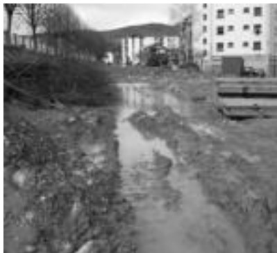
PPko zinegotziak ateratako zenbait argazki, Ugaren dauden obren egoera salatzen. RAUL VAZQUEZ