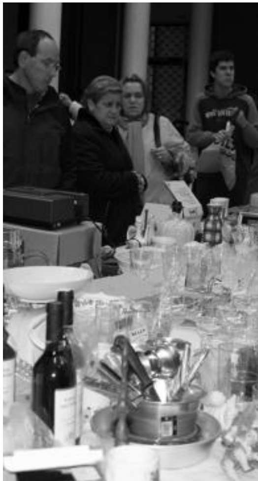
Merkatu Txikiko une bat, Tolosako Kultur Etxean. E. EZBIZA

Merkatu Txikian izan zen gertaera bitxirik ere, izan ere, herritar batek bere berokia utzi zuen une batez beste arropa zegoen lekuan, eta nahigabe hartu eta erosi egin zuten. Horren berri eman zuten HITZAN, eta segituan azaldu zen berokia erosi zuena, eta bueltatu egin zuten. Berokiaren jabeak eskertu egin nahi izan du herritar horren jarrera.