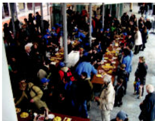
Zerkausia jendez lepo zegoen, aurkezpenaren unean.