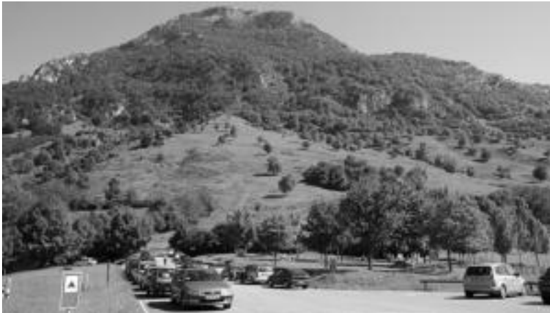
Gaintzatik aterata Abaltzisketara abiatuko dira ibilaldian igandean. Horretarako Larraiztik pasako dira. N. U.