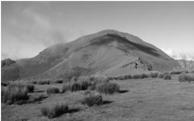
Autza mendia igoko dute Aizkardirekin joango diren mendizaleek igandean. HITZA