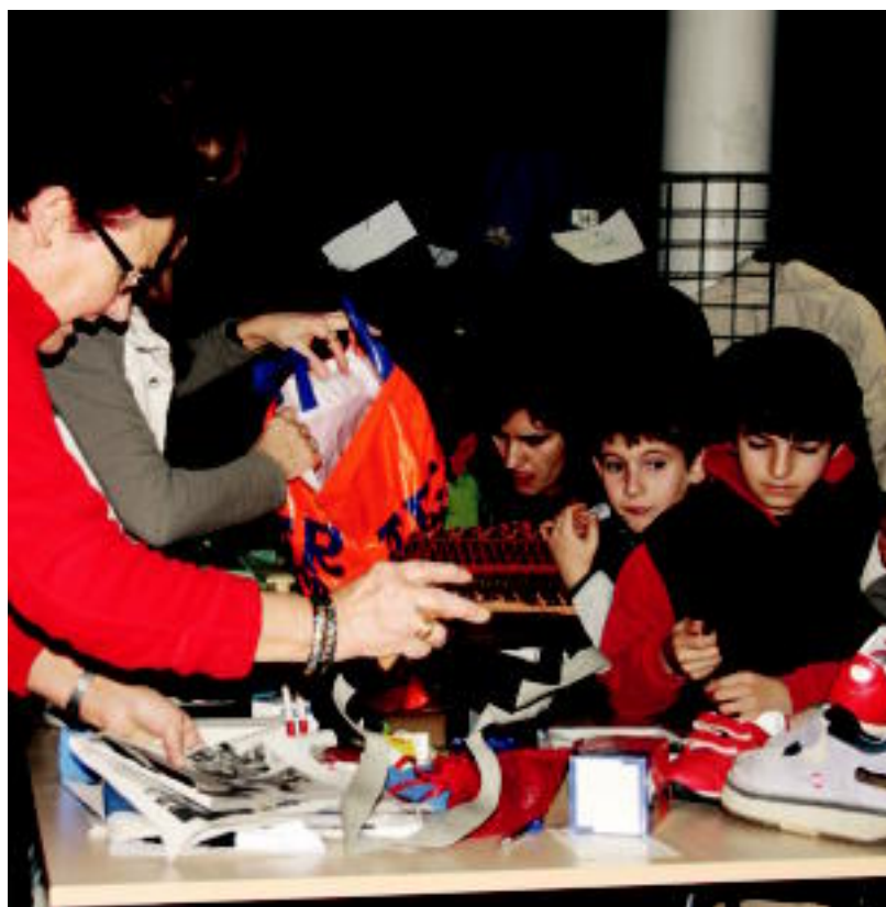
Bildu duten diru guztia Ekuador eta Sahara laguntzeko bideratuko dute.