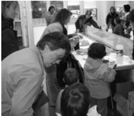
80 metro inguruko da liburutegia. Momentuz 4.500 liburu inguru daude n. u.

Txoko edo atal ezberdinak daude: mahai handi bat 12 bat laguntzako, txiki-txoko bat (6-7 urte ingurukoentzat) eta prentsa irakurtzeko gunea. Liburuak honela daude ordenatuta: helduentzako nobelak, kontsulta gunea (hiztegiak, entziklopediak...), euskal atal bat (Euskal Herriarekin lotutako