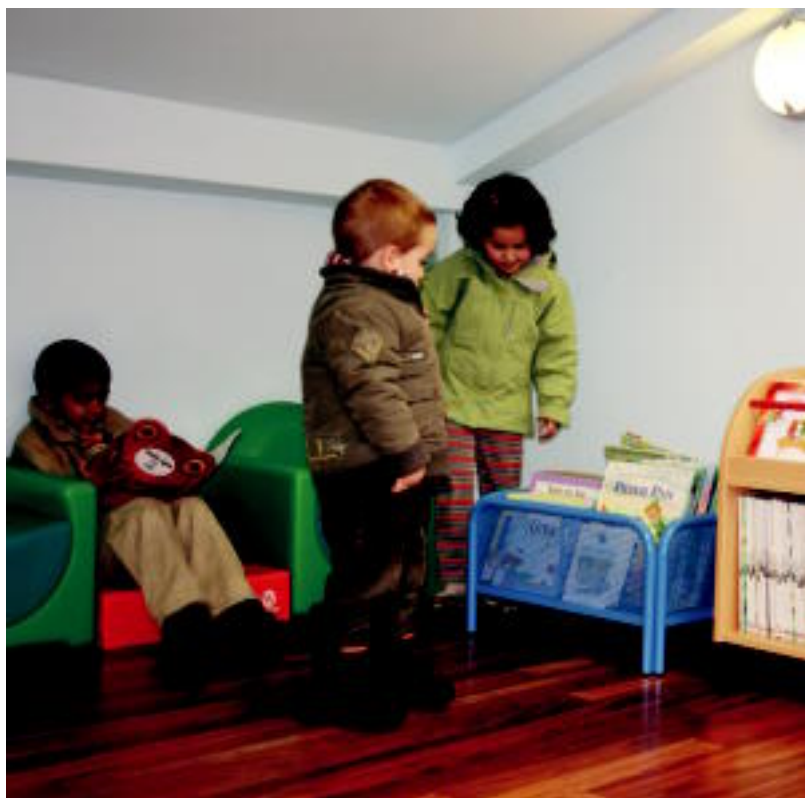
Jende asko izan zen atzoko inaugurazioan. Gaztetxo batzuk lehen unetik hasi ziren irakurtzen. N.URBIZU