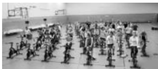
Ibarrako Belabieta kiroldegian Spinning ikastaroa antolatuta dute.