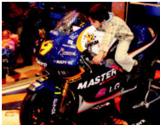
Dendaren barruan kokatuta zegoen motor ikusgarri hau. ESTI EZEIZA

Bi motoristen kasuan, 2006an lortutako postua izan da orain arteko onena. Dena den, oraindik ere gazteak dira eta ibilbide luzea dute aurretik.