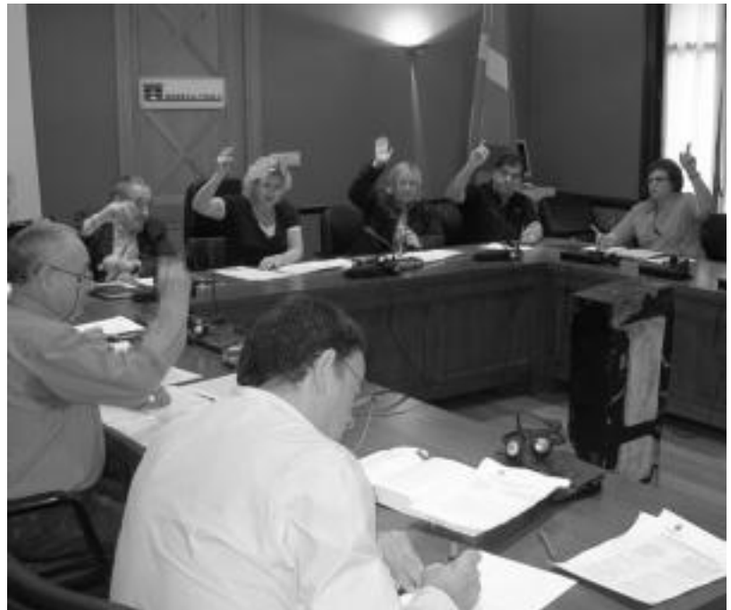
Ibarrako udaletxean burututako Ohiko Udal Bilkuraren irudia. ASIER IMAZ

Hirurekin mozkorkeri latza. Sagardoa lasaia goa, txakolina erraz hartzen dena, baina gero erotzen zaituena, traidorea eta ardoa ezagutzen dugunez, kontrolatzeko errazagoa.