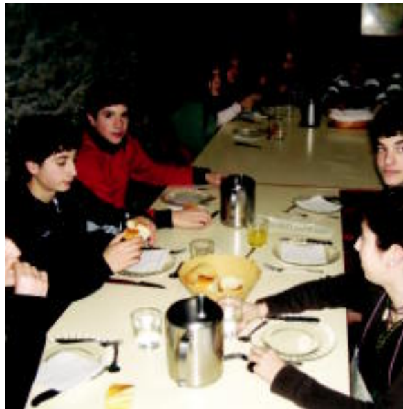
Ezkerrean, Helduak taldeko gazteak, Altzon. Eskuineko argazkian, berriz, Koxkorrek taldeko gaztetxoak, Agurainen. HITZA

HITZAK ez du bere gain hartzen egunkariaren adierazitako esaneren eta iritzien erantzunik.