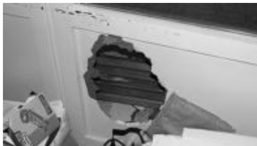
Liburutegietan hainbat txikizio egin dituzte lapurrak. HITZA

zegoen eta hori itzaltzen jakin zutelako.