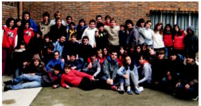
Bizkorrek taldeko kideak. Hauek Loiolan igaro zituzten Eguberrietako egunak. HITZA

Eguberrietan Kirikiño aisialdi taldeko kideek kanpaketak izan zituzten abenduaren 26tik eta 31era, eta ederki igaro zuten, bai gazteek bai eta begiraleek ere. Koxkorrek taldeko (Lehen Hezkuntza 5. eta 6. mailak) 80 neska-mutil Agurainen izan ziren; Bizkorrek taldeko (DBH1 eta 2) 90 neska-mutil Loiolan, eta Helduak-eko (DBH3 eta 4) 50 neska-mutil Altzon.