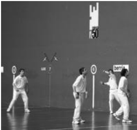
luz, Aurrera-Saiaz Berria Txapelketako norgehiagoka batean. N. LIZARTZA