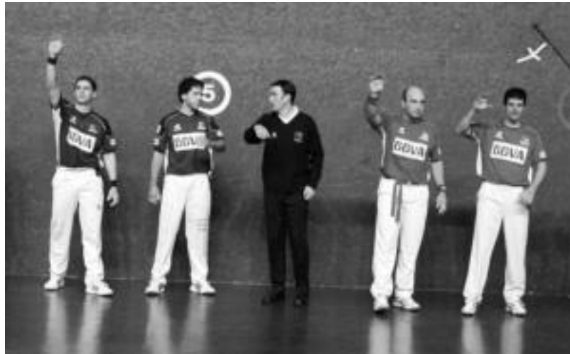
Atzo Beotibarren txapelketa honen barruan Eugi eta Lasa III.a Olaizola I.a eta Belokiren aurka lehiatu ziren. A. IMAZ

Norgehiagokak 2 zati izan zuten, lehenengoan ezbairik gabe Koka eta Begino ia zuzenean garaipeñera iritsi ziren. Norgehiagokak jada irabazitatzutenean, or-