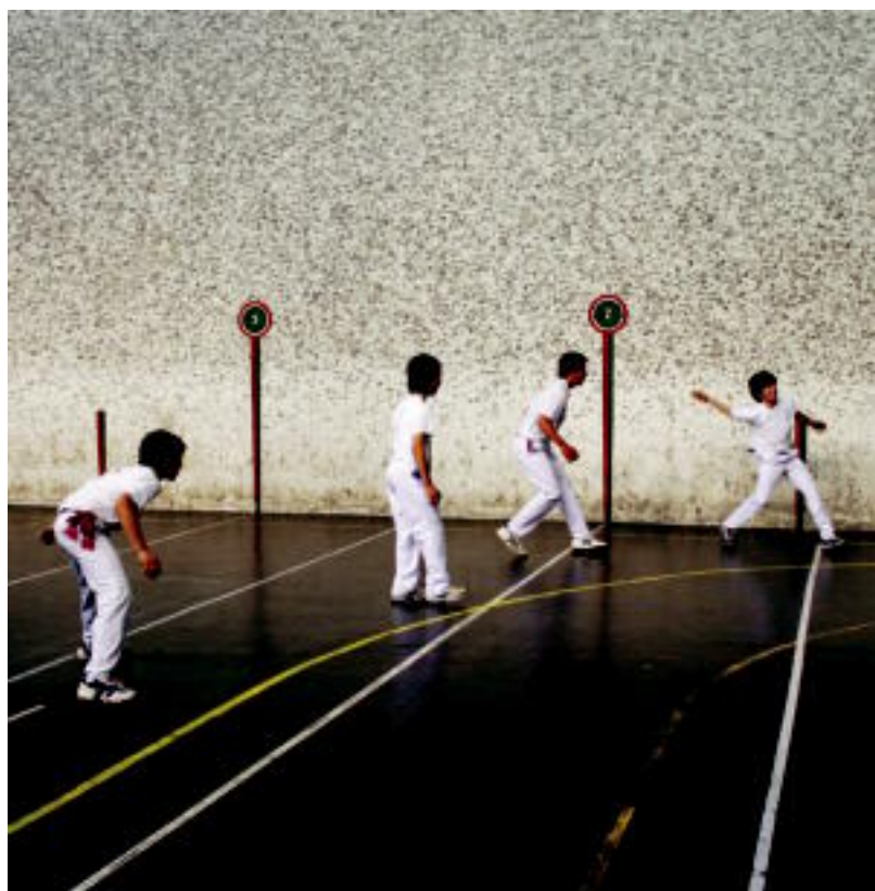
Atzoko Topaketako finalerako bat, Elorri pilotalekuan.

HERRITARRAK Aurrekontuak osatzeko herritarrei inkesta bat helarazi zieten; «oso egokia» izan dela azaldu dute »