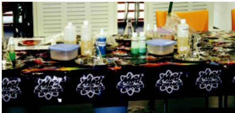
Material ugari erabili zuten gaztetxoek esperintziak egiteko. A. IMAZ

8 eta 14 urte bitarteko 20 gazte inguru gerturatu ziren Sumenditik Ozeanora izeneko tailerlean parte hartuz. Irakasleak era jostagarrian azaldu zizkien sumendiei buruz jakin beharrekoak, eta era prektiko baten bidez, gaztetxoek euren sumendiaren erupzioa sortzeko aukera ere izan zuten. Esperintzia bitxia, beraz.