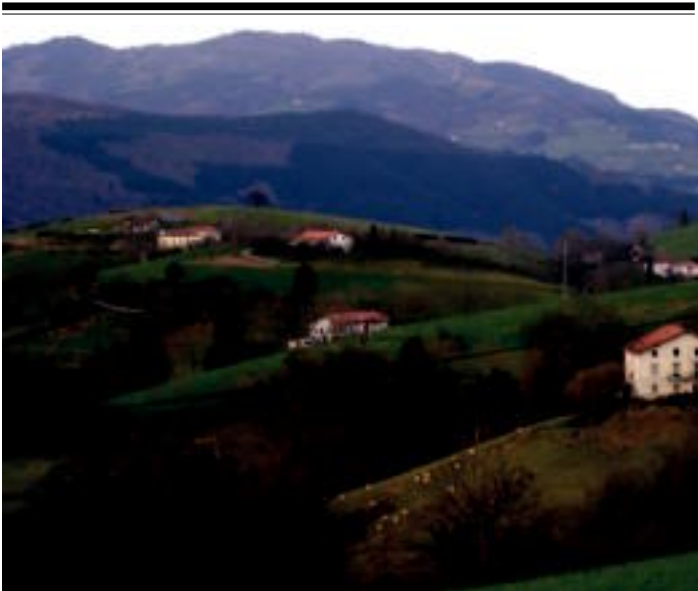
Txindoki mendian magalean aurki daitekeen nekazaritza giroko paisaia da. Inguru hauetan oraindik bizirik jarraitzen du baserri munduak.