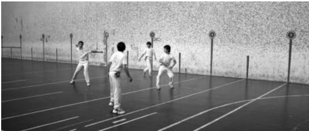
Eguberrietako pilota topaketan finalak batez atzo Alegiko Elorri pilotalekuan. IMANOL GARCIA

LEITZA » Gaur Aurrerak bigarren itzuliko lehenengo norgehiagoka jokatu du Lagunak taldearen aurka, 12:00etan, herrian bertan. Lehenengo itzuliko partidari Lagunak taldeak 1-0 emaitzarekin irabazi zuen, eta lehenengo postuan doa 34 punturekin. Aurrera, berriz, zortzigarren doa, 23rekin.