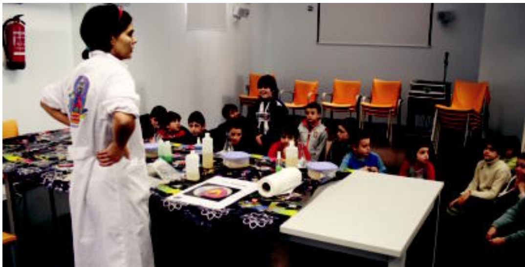
Gaztetxoak tentuz entzun zuten sumendien inguruan jakin beharrekoak. ASIERIMAZ

HITZAK ez du bere gain hartzen egunkariaren adierazitako esaneri eta iritzien erantzunik.