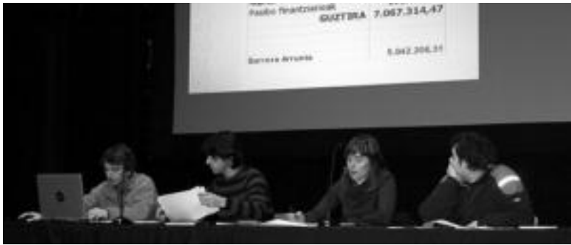
EAE-ANVko kideek aurrekontuaren proposamena publikoki aurkeztu zuten Gurea aretoan. I. GARCIA