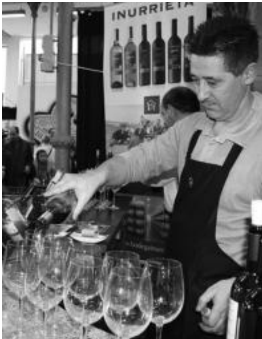
Ardo bereziak dastatzeko aukera izan zuten bertaratu zirenek. ESTI EZEIZA