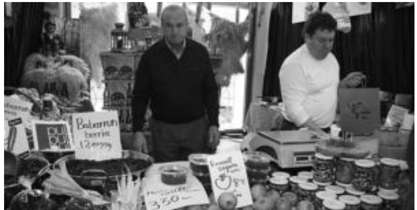
Postu guztietan, euskal produktuak erosteko aukera izan zuten hurbildutakoek. ESTI EZEIZA