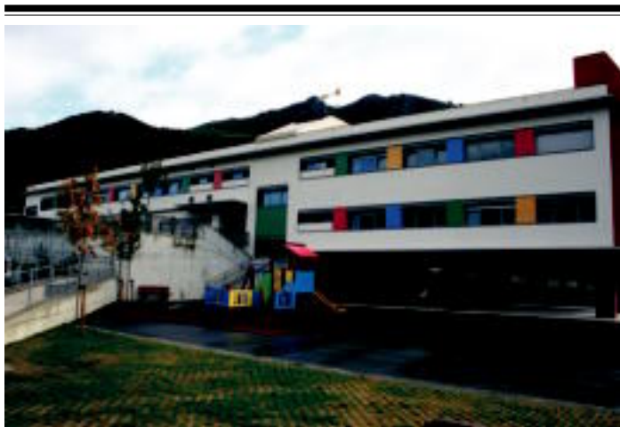
Ingurugiroa eta natura errespetatzen duen Samaniego ikastetxearen eraikin berria.

Eskelei buruz daukagun ideia guztiak aldatu nahi izan dute Samaniego ikastetxetik, eta horregatik, naturarekiko errespetuan oinarrituriko eskola ekologikoa, solidarioa eta osasuntsua eratu dute.