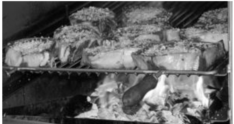
Jendearen aurrean, Zerkausian bertan, erre zituzten txuletak sukaldariek. ESTI EZEIZA