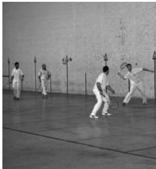
Herenegun jokaturako finaleko uneetako bat. IMANOL GARCIA

Berrobi ▶ Binakakoan, nesketan, Onsalo eta Gartzia renak irabazi dute; mutiletan, aldiz, Romerok eta Gomezek