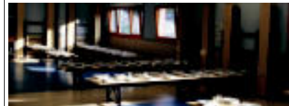
Ikastetxe berrituaren jangelako irudi bat. H. BELLOSO

Ikastetxe ume guztiak naturaren inguruko marrakiaz egin dituzte eta hauek ikastetxearen hormetan jarri zituzten ikusgai. Kasu hoveletan, zaborbertzietan ipintzea aholkatzen digu. H. BELLOSO