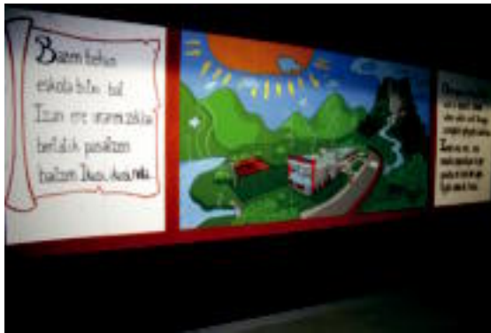
Umeek uraren zikloa errazago uler dezaten eginko horma-pintura. H. BELLOSO